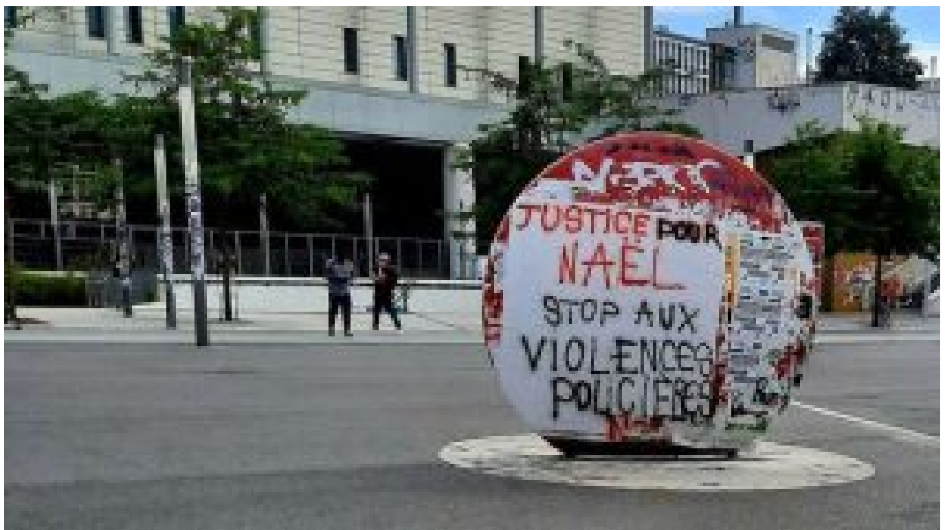
Illustration de "À Nanterre : "Nous n'avons pas besoin de leçons pour éduquer nos enfants !" , un article de Radio France.