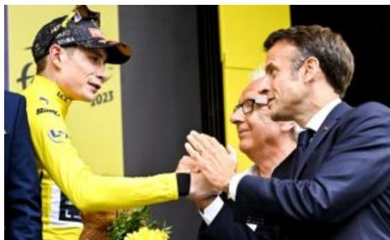
Macron au Tour de France

Le Macron, tout ragaillardi, a, ensuite, présidé la cérémonie d'hommage national au combattant pour la libération de la France, Léon Gautier.