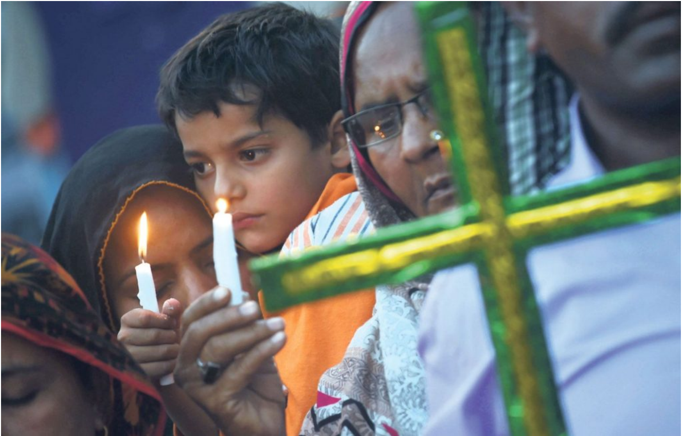
Illustration : chrétiens du Pakistan