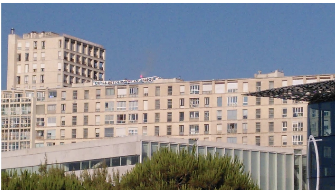
Une banderole a été déployée en haut d'un immeuble à proximité du lieu du concert.