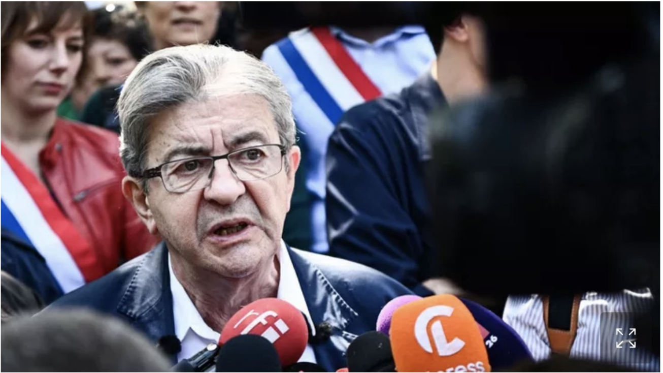
Jean-Luc Mélenchon lors d'une manifestation dans le cadre de la 14e journée d'action contre la réforme des retraites à Paris le 6 juin 2023.

On comprend pourquoi le monsieur « La République c'est moi » est européiste... Ce gars n'aime ni la France ni les Français (tous des alcooliques, disait-il des Normands alors qu'il arrivait de son Maroc natal).