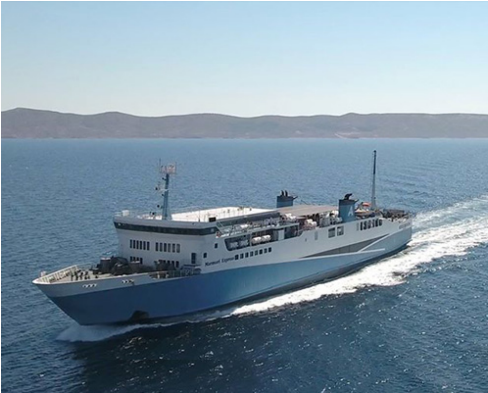
Un ferry Marmari Express – Karystia Lines