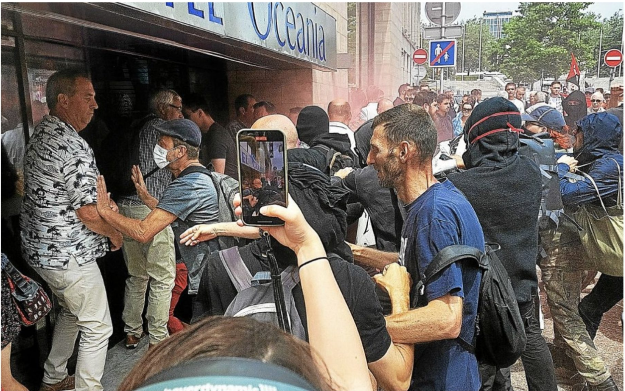
Les sympathisants et services d'ordre se sont repliés à l'intérieur de l'hôtel, pendant que les manifestants essayaient d'entrer en force dans l'hôtel Océania de Brest, rue de Siam.