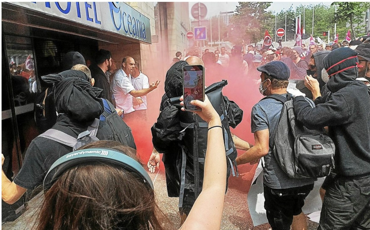
La situation s'est tendue devant l'hôtel Océania à l'heure prévue pour la dédicace.

Une seule réponse, Darmanin : la dissolution des hordes fascistes, Insoumis, CGT, NPA... et la longue suite des organisations ayant appelé à manifester ci-dessous.