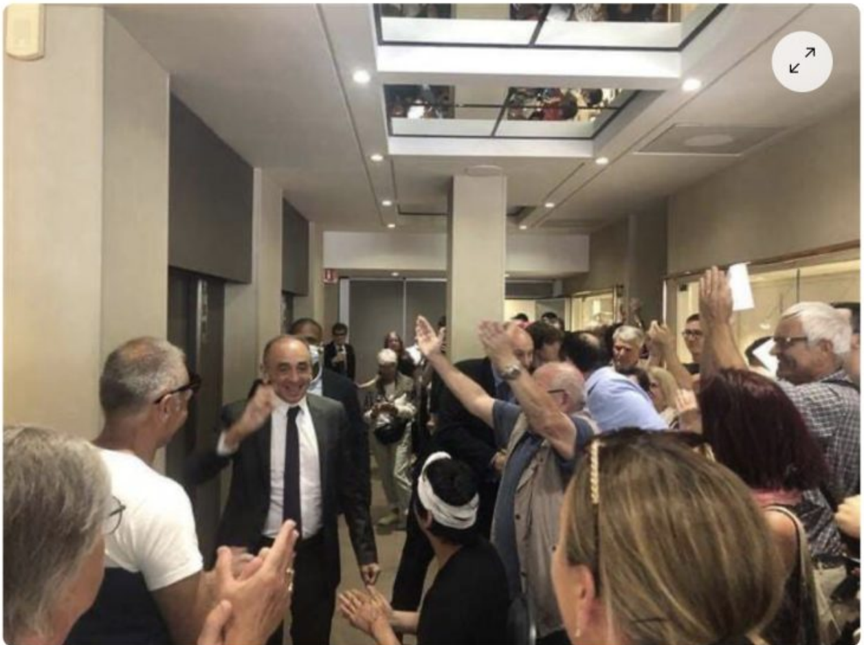
Dans l'hôtel, Eric Zemmour est venu apporter son soutien au militant blessé.

écrit par Christine Tasin | 17 juin 2023