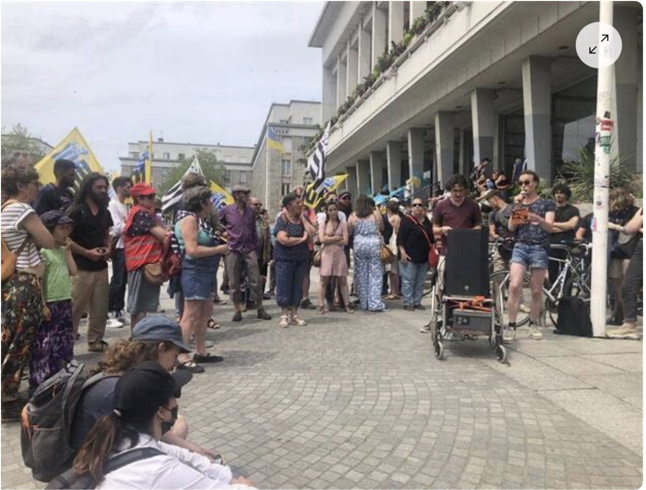
Place de la Liberté, les militants écoutent la prise de parole contre la venue d'Eric Zemmour à Brest, avant de se déplacer devant l'hôtel où l'auteur dédicace.

Les fascistes de demain s'appelleront eux-mêmes anti- fascistes