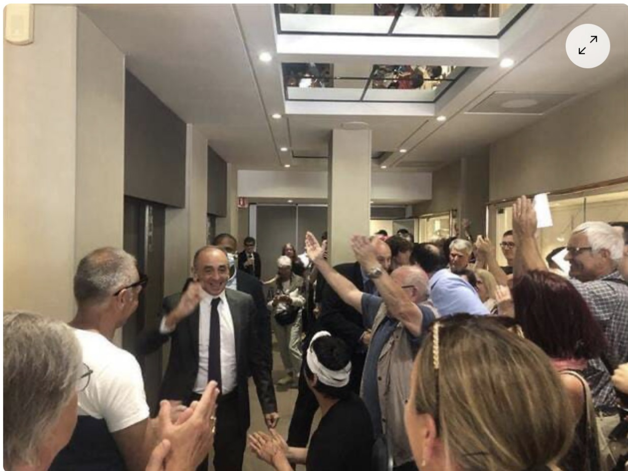
Dans l'hôtel, Eric Zemmour est venu apporter son soutien au militant blessé.