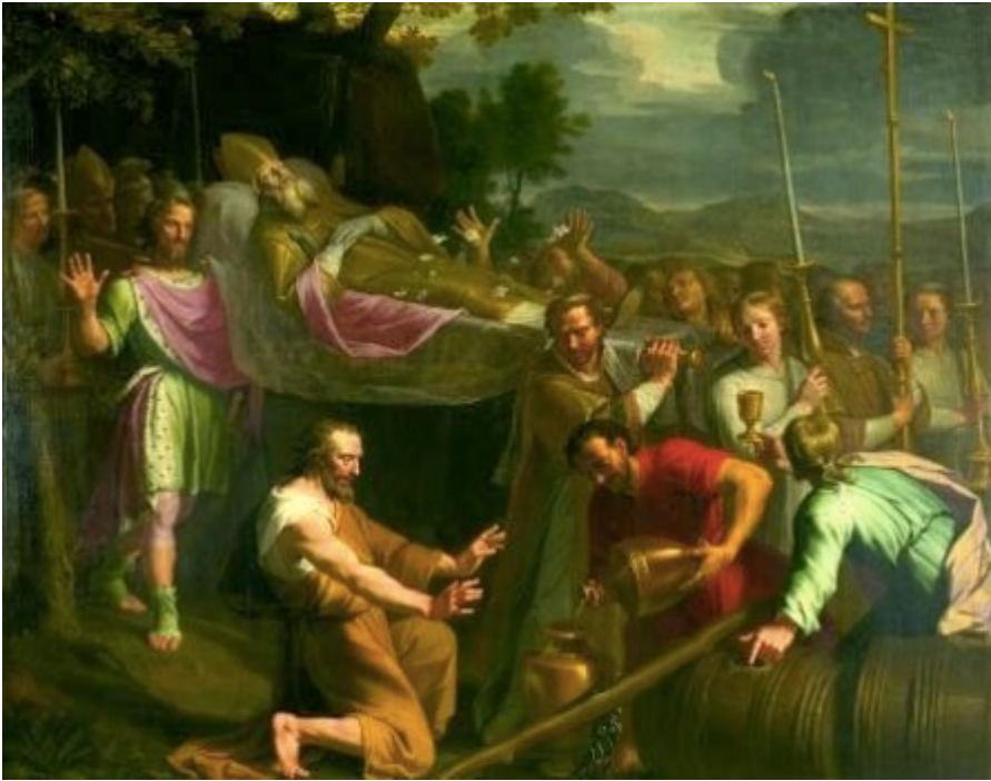
« Le miracle de la bière » par Jean-Baptiste de Champaigne