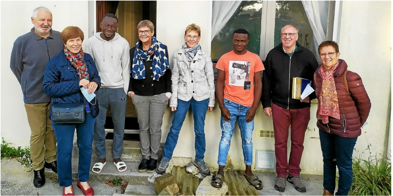
Le collectif « 100 pour 1 toit Brest Rive Droite » accompagné de deux jeunes migrants