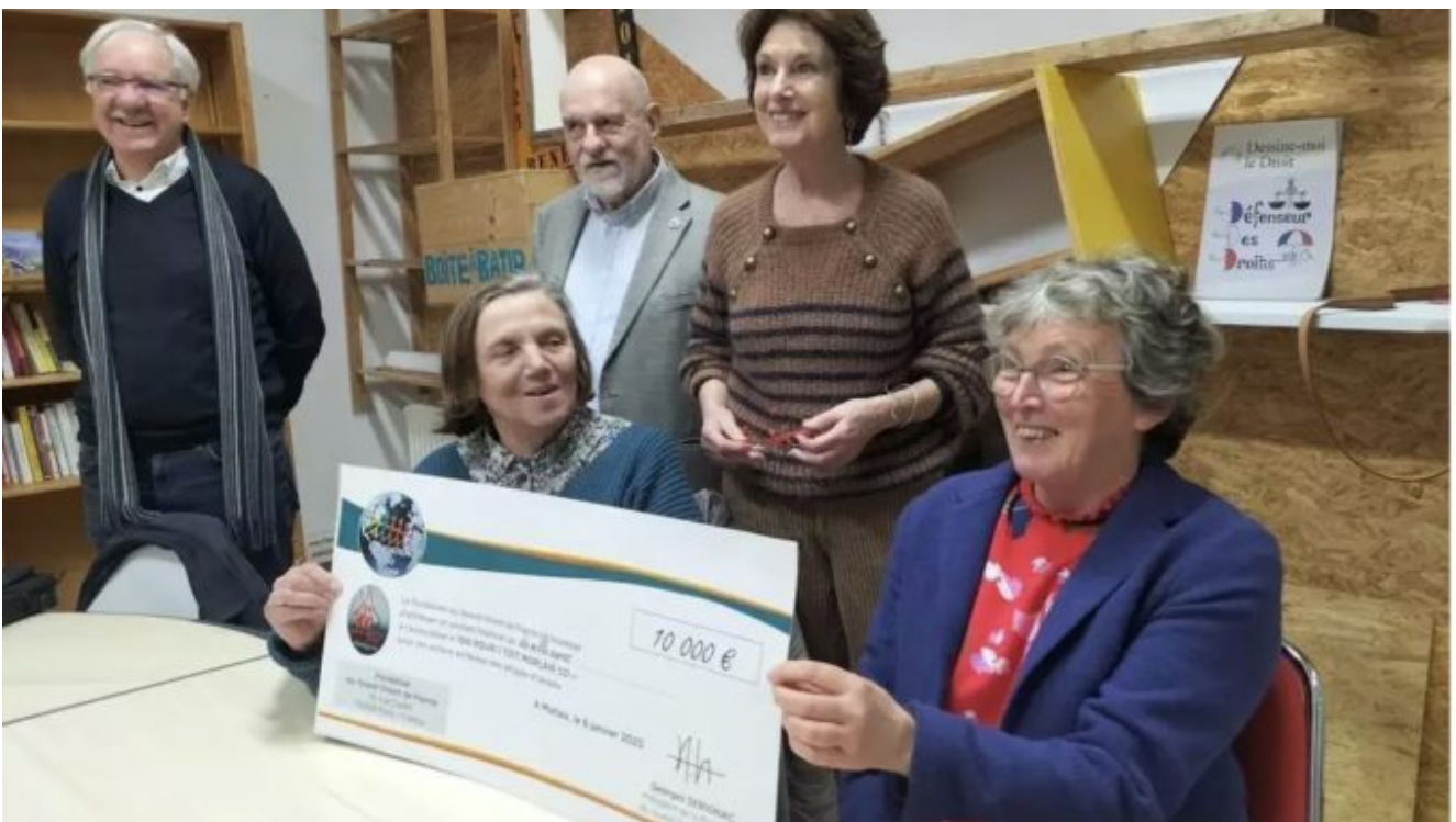
« À Morlaix, un don à 100 pour 1 Toit pour aider les exilés »

Voici qui siège à son conseil d'administration ☐