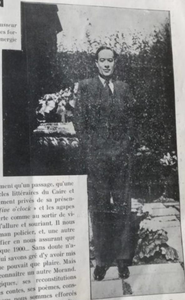
Paul Morand dans son jardin

Voici pourtant la preuve de notre fraîche assiduité. Monsieur Paul Morand constatera que le temps n'a pas effacé le souvenir de son passage au milieu de nous, en mars dernier. Car, ce n'était vraiment qu'un passage, qu'une escale entre de rapides périples et les cercles littéraires du Caire et d'Alexandrie, nous-mêmes, avons été sévèrement privés de sa présence. Il nous est apparu tout juste entre le « five o'clock » et les agapes du soir, sur l'estrade du Lycée Français, alerte comme au sortir de vigoureuses ablutions, le pas décidé, sportif d'allure et souriant. Il nous a entretenus certain jour de l'attrait du roman policier, et, une autre fois, il a plaisamment tenté de nous mystifier en nous assurant que nous retournions aux douces folies de l'époque 1900... Sans doute n'avait-il dessein que de nous distraire et nous lui savons gré d'y avoir mis tant d'esprit. Un tel pétilllement de malice ne pouvait que plaire. Mais la lecture de ses ouvrages nous a permis de connaître un autre Morand. Ses récits de voyage, ses analyses psychologiques, ses reconstitutions d'époque, ses réflexions, ses descriptions dont nous nous sommes efforcés d'extraire l'essence, avec l'espoir, sinon d'y avoir réussi, du moins d'avoir rendu un cordial et sincère hommage au talent de l'auteur de « La route des Indes ».