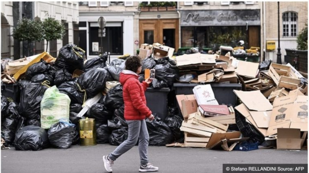
Les déchets s'accumulent à Paris en raison de la grève des éboueurs.

écrit par Christine Tasin | 15 mars 2023