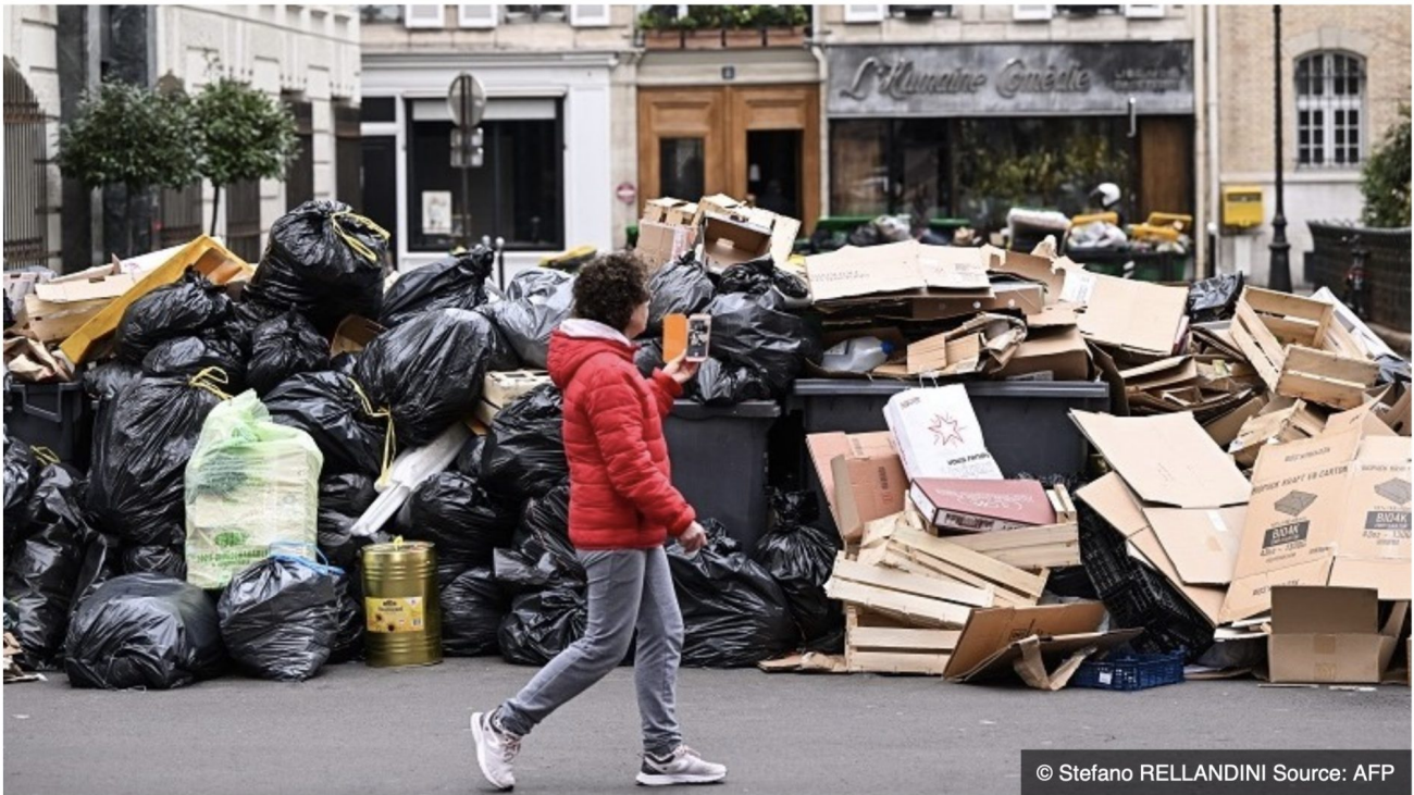
Les déchets s'accumulent à Paris en raison de la grève des éboueurs.

Le cas @annesouyris n'est malheureusement pas unique dans l'équipe de dangereux branquignols autour d' @Anne_Hidalgo à la mairie de @Paris ... ☐☐ https://t.co/mxxhdnLY1S