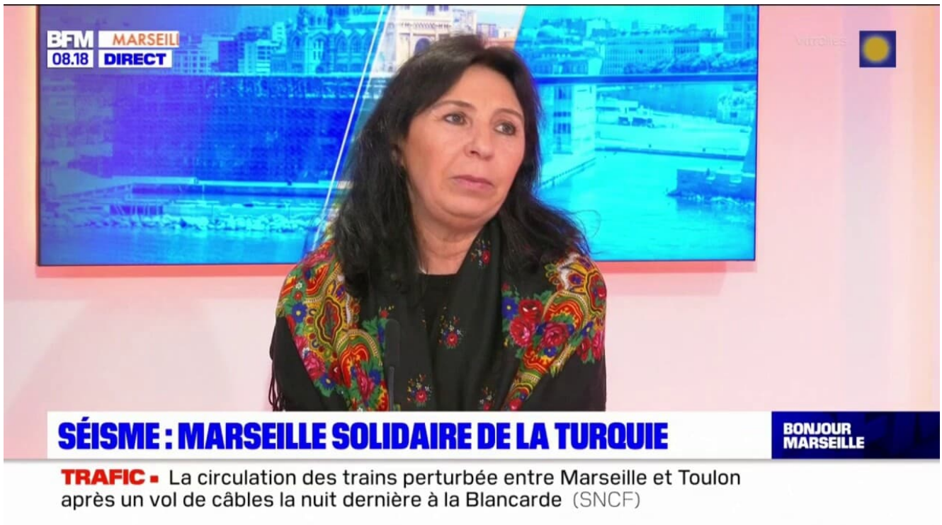
Illustration : vendredi 10 février 2023 sur BFM Marseille Provence , un « appel aux dons » lancé pour les victimes des séismes en Turquie

Que deviennent les dons des Français (et autres Européens) à la Turquie ?