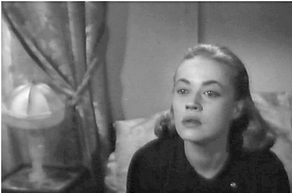
1959 Documentaire de Haroun Tazieff, Les Rendez-vous du diable