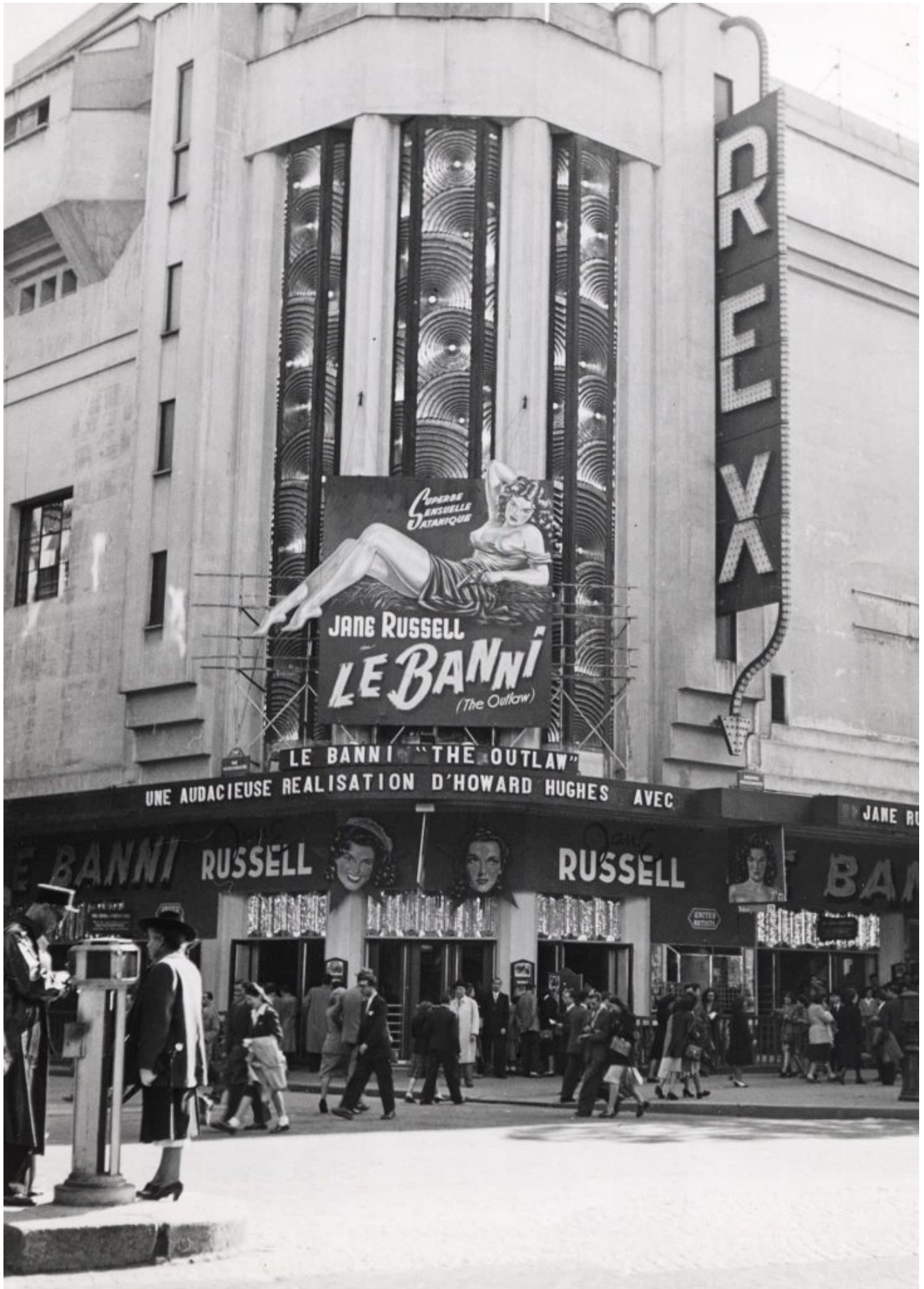
5 ans après sa sortie américaine le film « Le banni » put