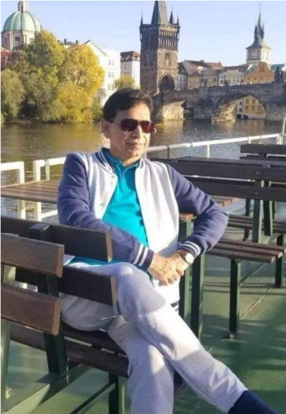
A gauche, photo du dermatologue en Europe.