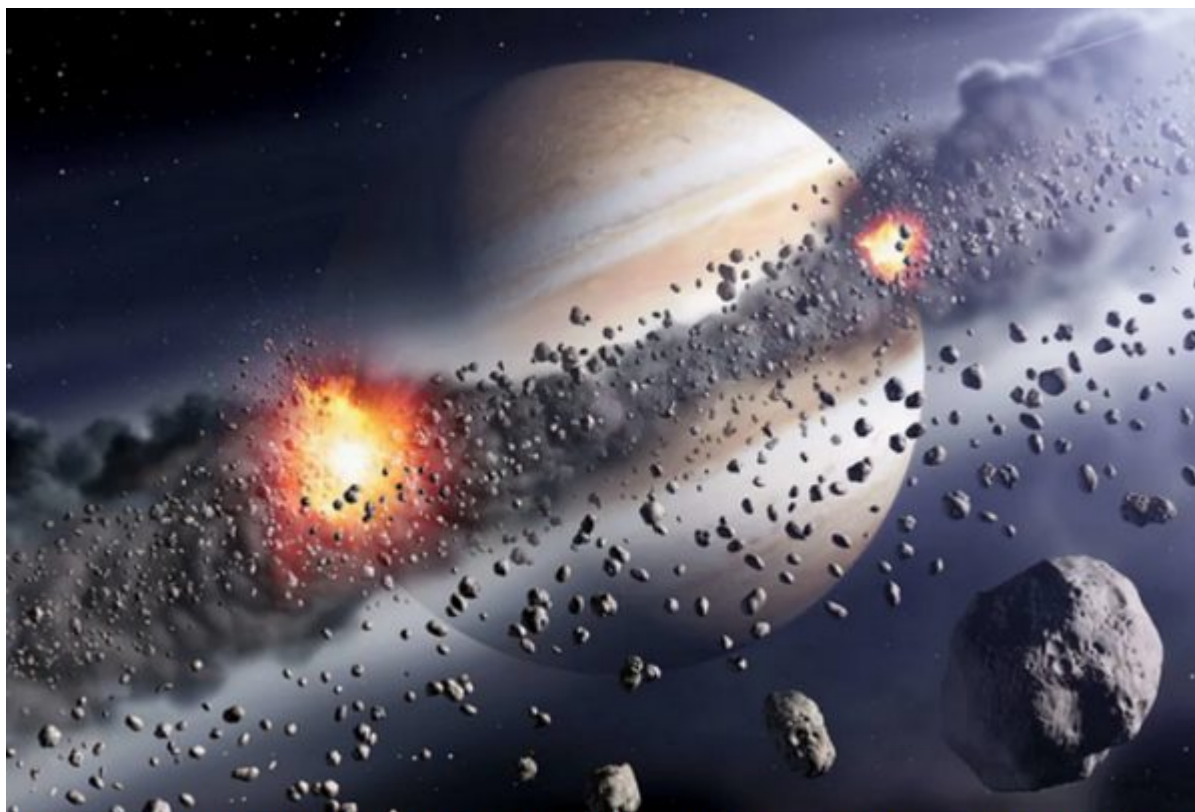
Jupiter et Saturne ont migré dans le jeune système solaire, semant le chaos autour d'elles..