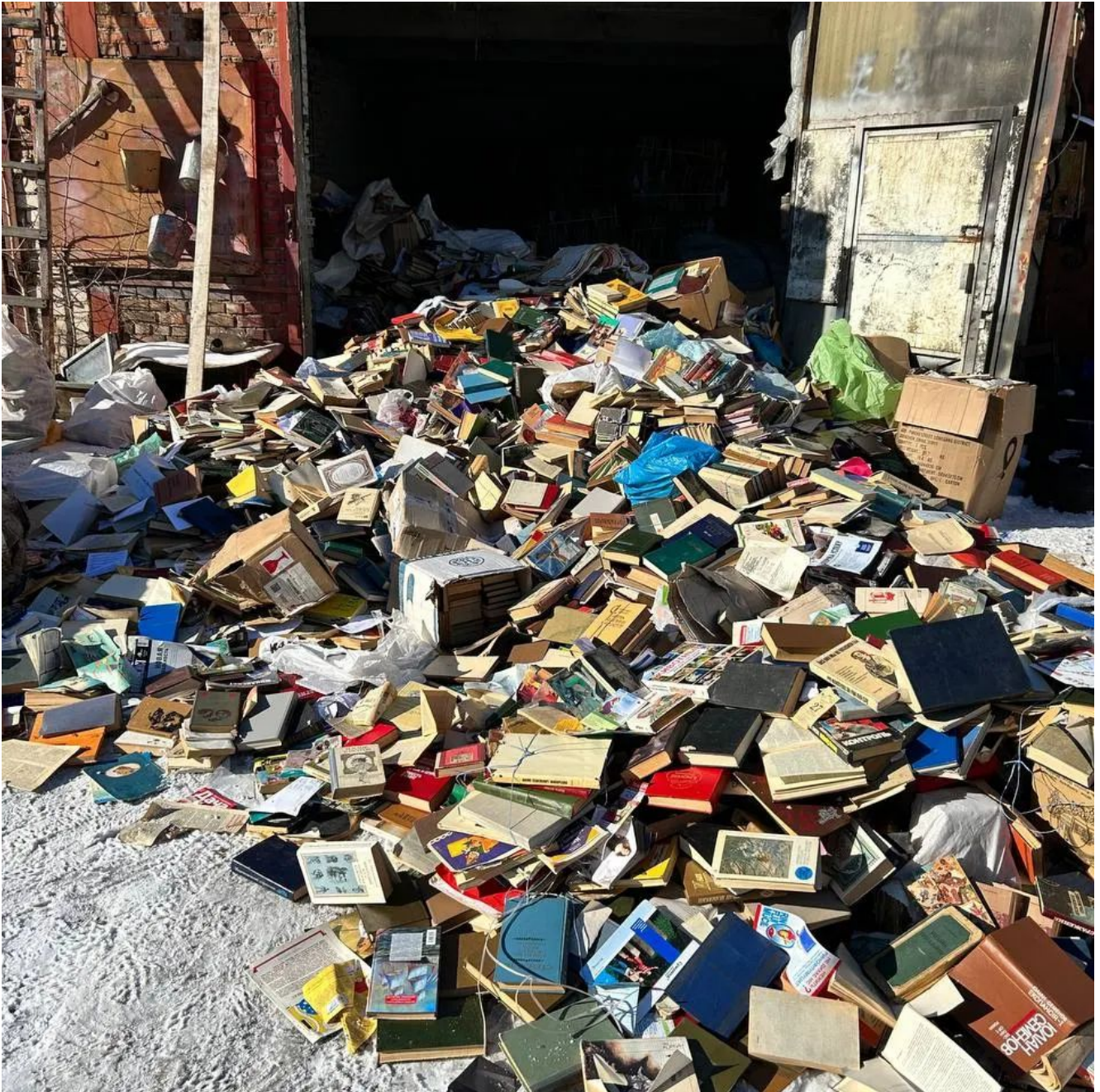
Photo : Les Ukrainiens sont invités à se débarrasser des livres en langue russe qui occupent leurs étagères.