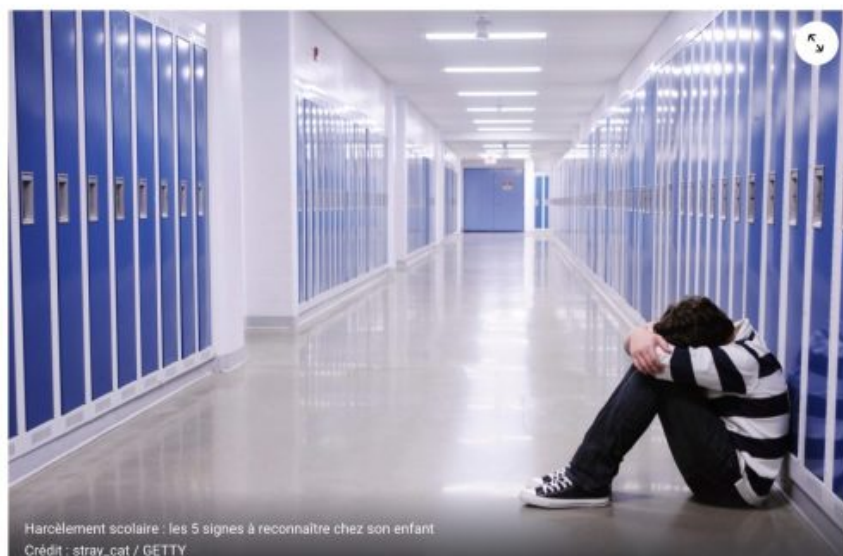
Harcèlement scolaire : les 5 signes à reconnaître chez son enfant