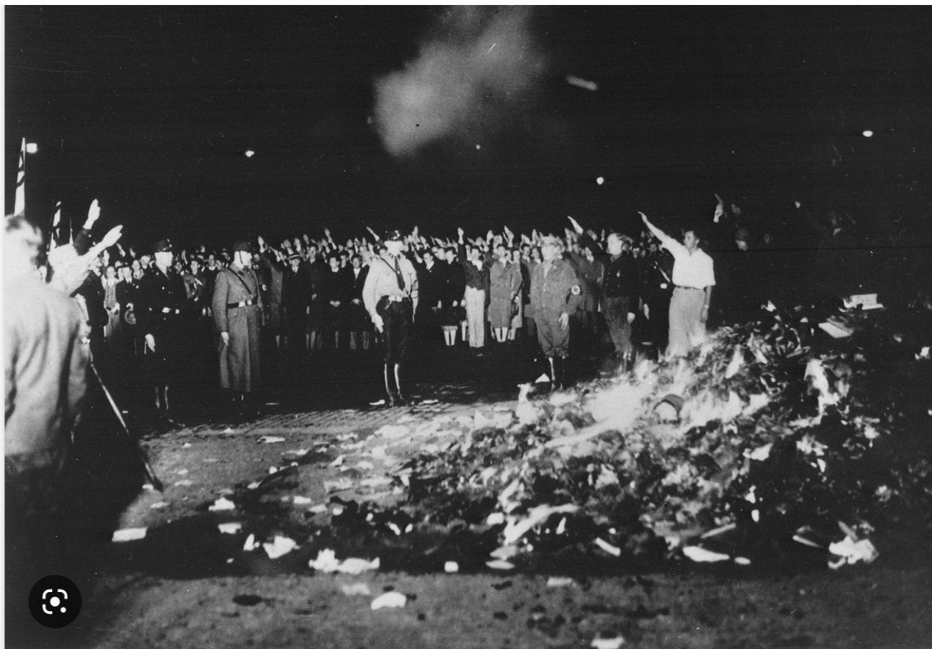
Autodafés de 1933 en Allemagne — Wikipédia

Parce qu'il ne faut pas s'y tromper. On a payé pour voir, pour savoir. Lutter contre la haine des musulmans (depuis quand peut-on prétendre interdire aux gens de ressentir ses sentiments ? ) c'est, forcément , la marche forcée vers les autodafés de tout ce qui, de près ou de loin, choque ou dérange les musulmans.