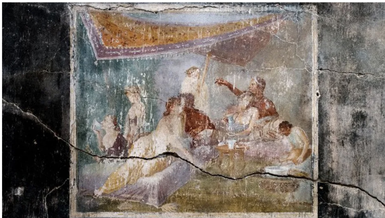
Représentation d'un baiser sur une fresque de la maison des chastes amants, Pompéi

Bientôt il faudra censurer les vers de Catulle célébrant la trop belle Lesbie et ses amours ? Bientôt les fresques de Pompéi célébrant les amours des couples traditionnels comme les amours homosexuelles (on n'avait pas de tabou à Rome) offertes en holocauste au monde musulman comme les Bouddhas de Bamiyan ?