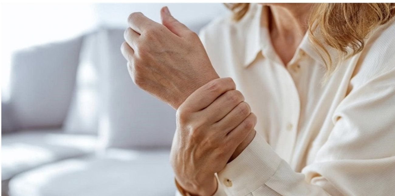
Le baume d'Aiguebelle convient pour les douleurs articulaires

Depuis mars 2022, les moines ont adapté la formule du baume d'Aiguebelle pour respecter les nouvelles réglementations européennes. Le seul changement concerne la base parfumante qui a été supprimée ! Ouf ! Le baume conserve donc toutes ses huiles essentielles et, avec elles, les bonnes odeurs et les vertus bienfaitantes qui font sa réputation.