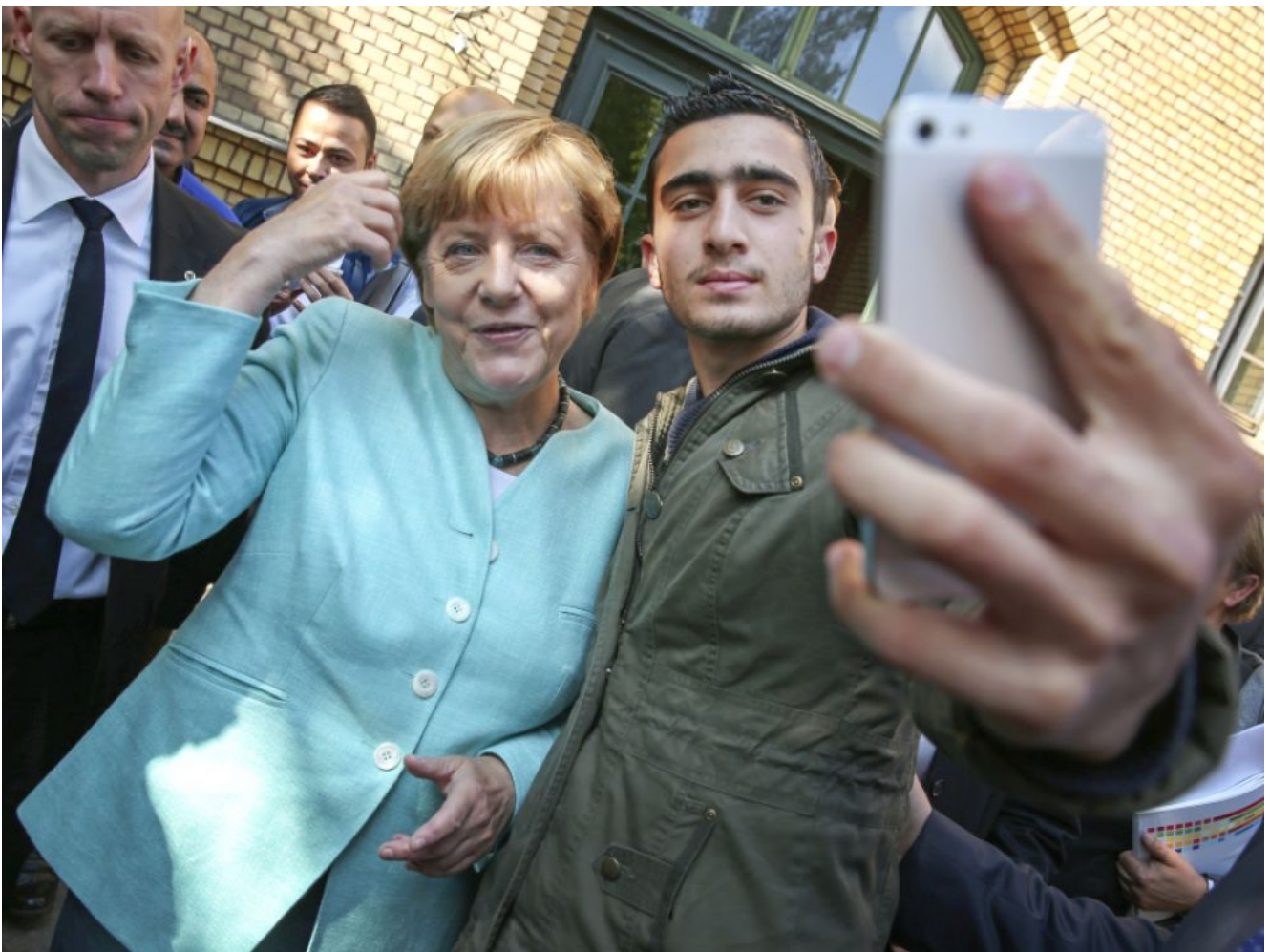
Merkel minaudant au milieu des Afghans en 2015

Ce prix est une gifle : non seulement pour les proches survivants des milliers de victimes de la « culture de l'accueil » de Merkel, mais aussi pour les citoyens et contribuables allemands qui portent le fardeau et subissent les effets de la décision solitaire de Merkel. En conséquence, plus de 4 millions de personnes sont venues en Allemagne depuis 2015, qui se sont installées directement dans les systèmes sociaux.