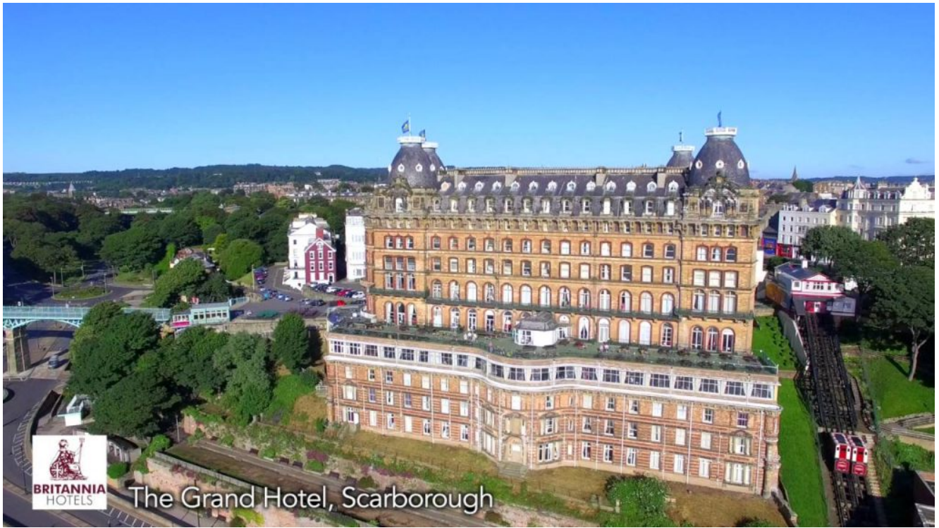
The Grand Hotel, Scarborough