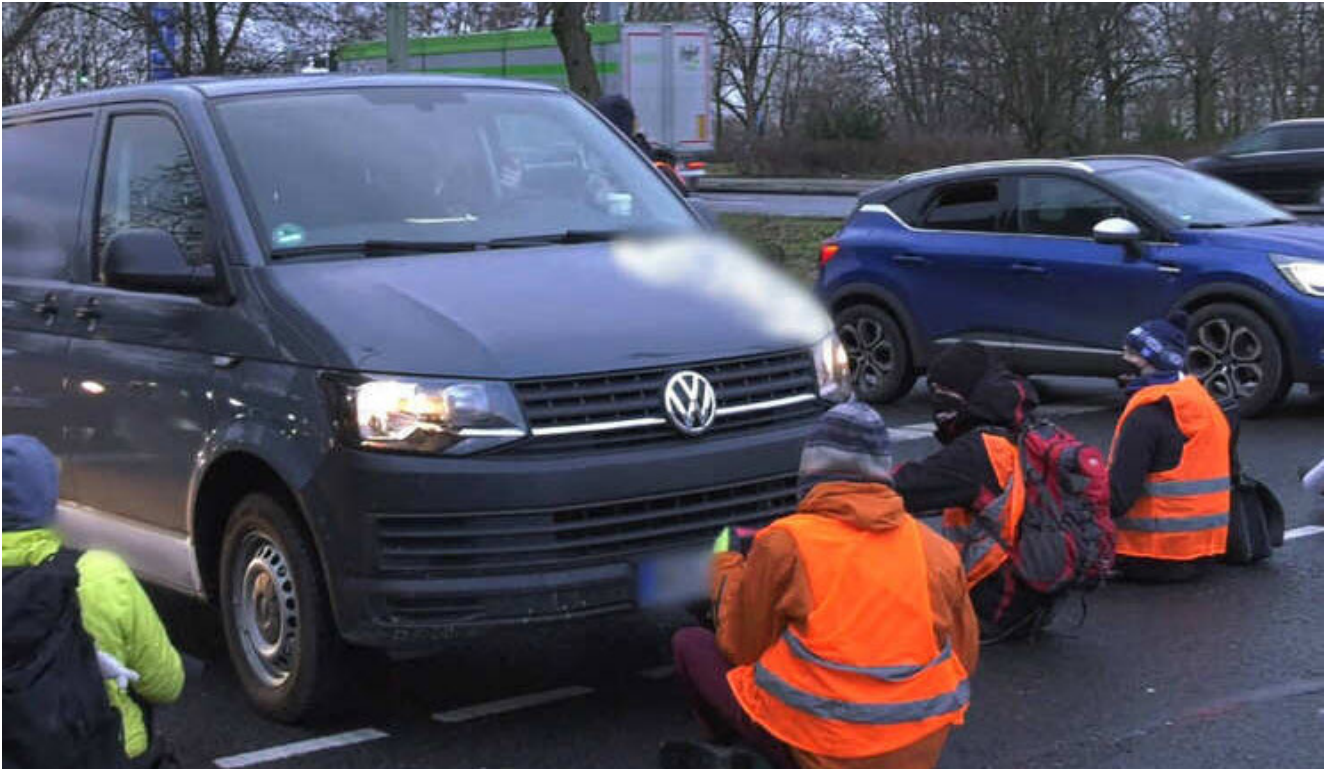
Image d'illustration : des activistes pour le climat se collent au bitume, bloquant les gens qui vont au travail .