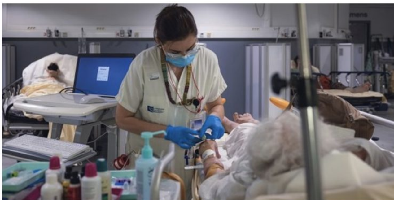
En 2022, les hôpitaux ont été submergés par les vagues de décès liés à la pandémie.