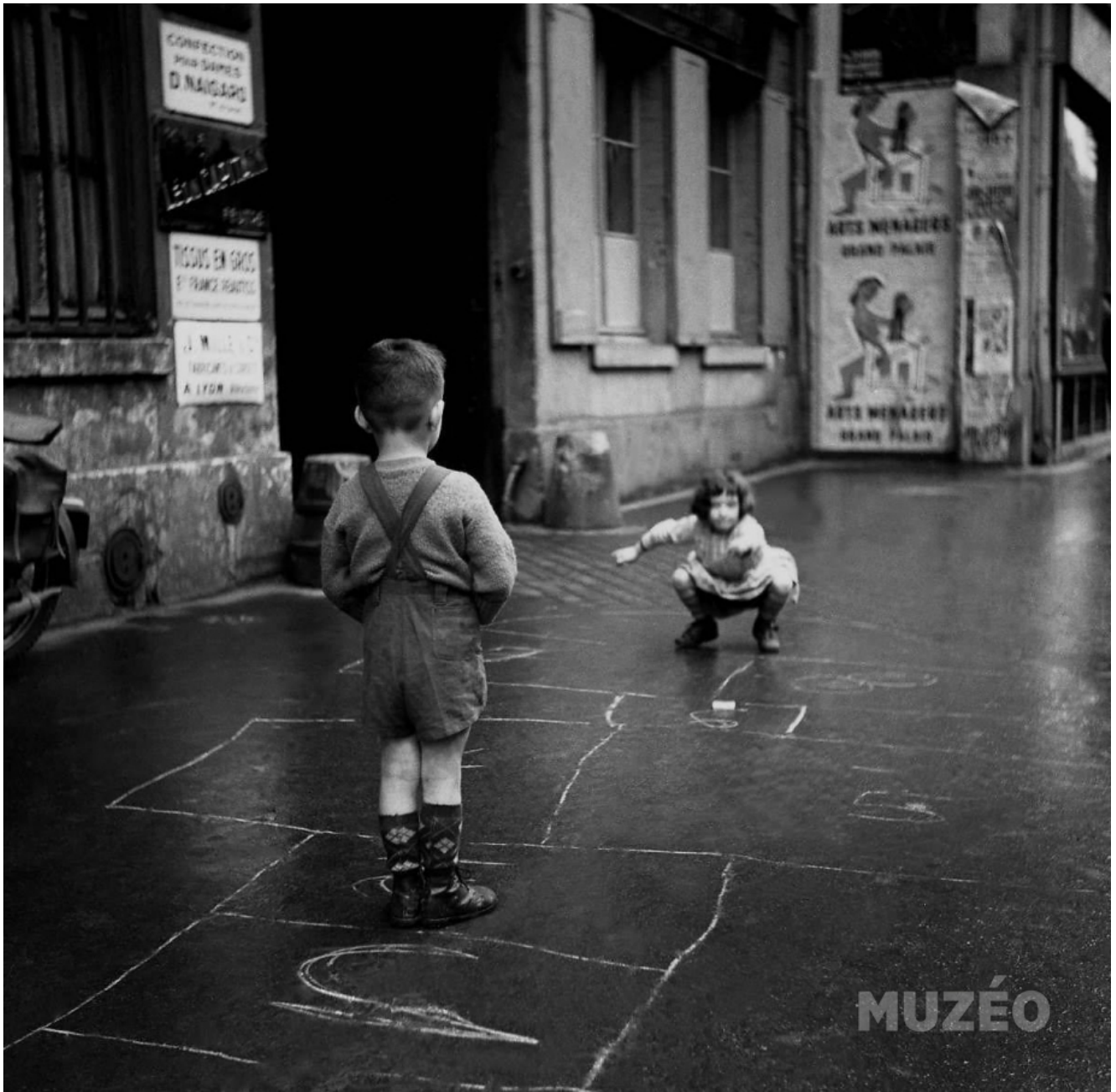
La marelle, 1960 – Photo Gérald Bloncour