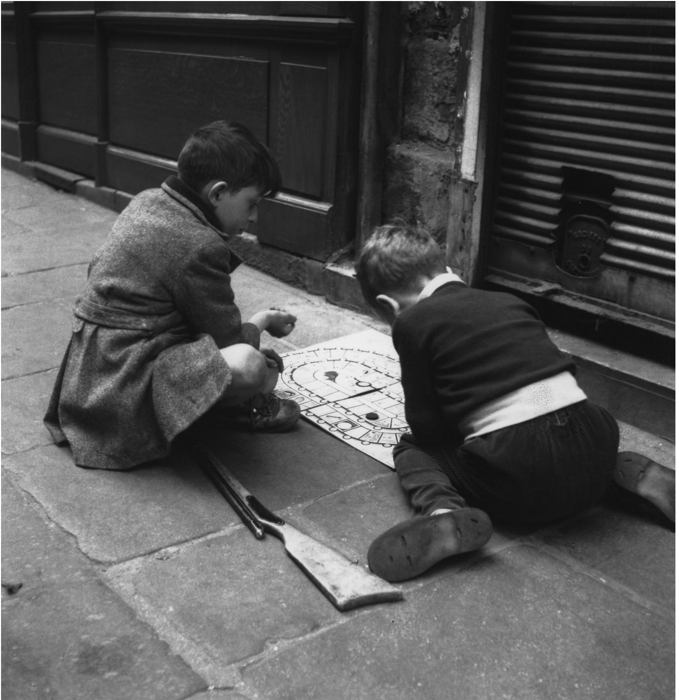
Dans le Marais