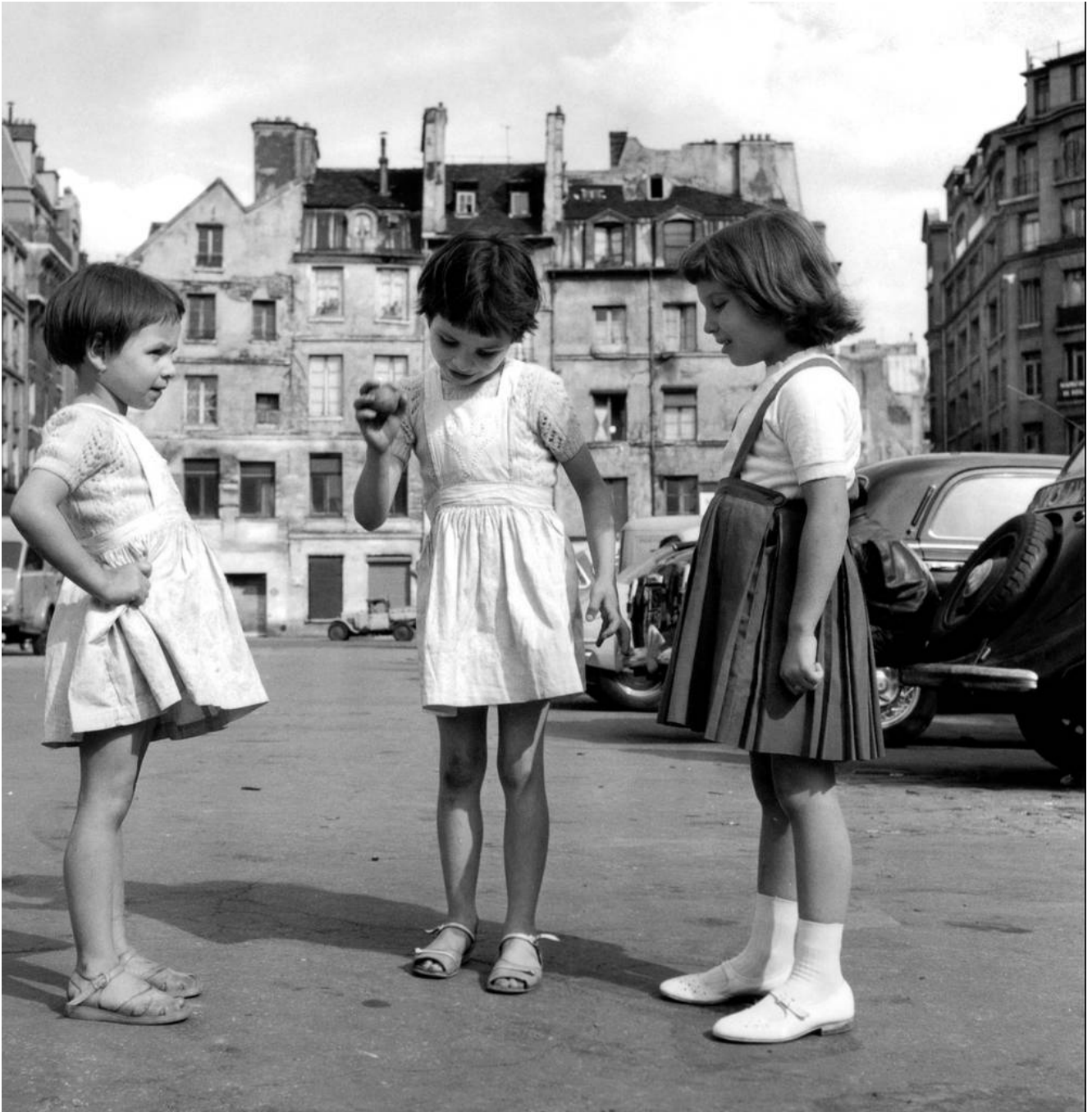
Enfants jouant sur le plateau Beaubourg, rue Saint-Merri. Au fond la rue Brisemiche. le 3 août 1959