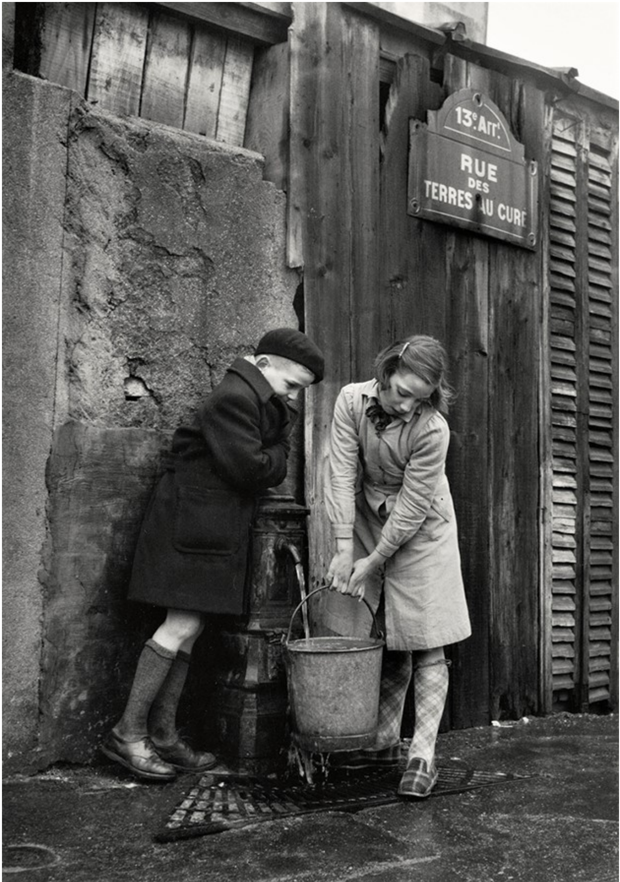
Rue des Terres au Curé, 1954