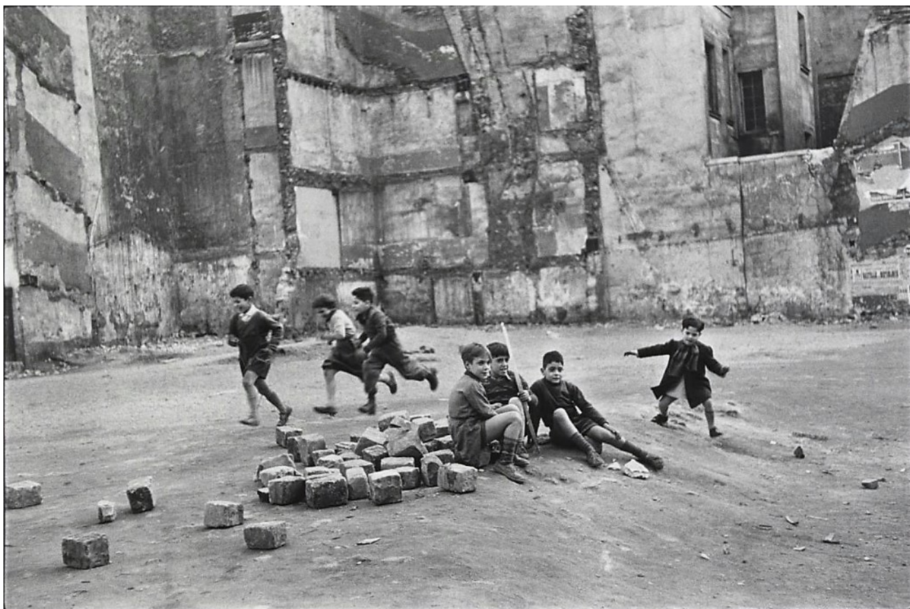
Le Marais, 1952. Enfants jouant dans un terrain vague