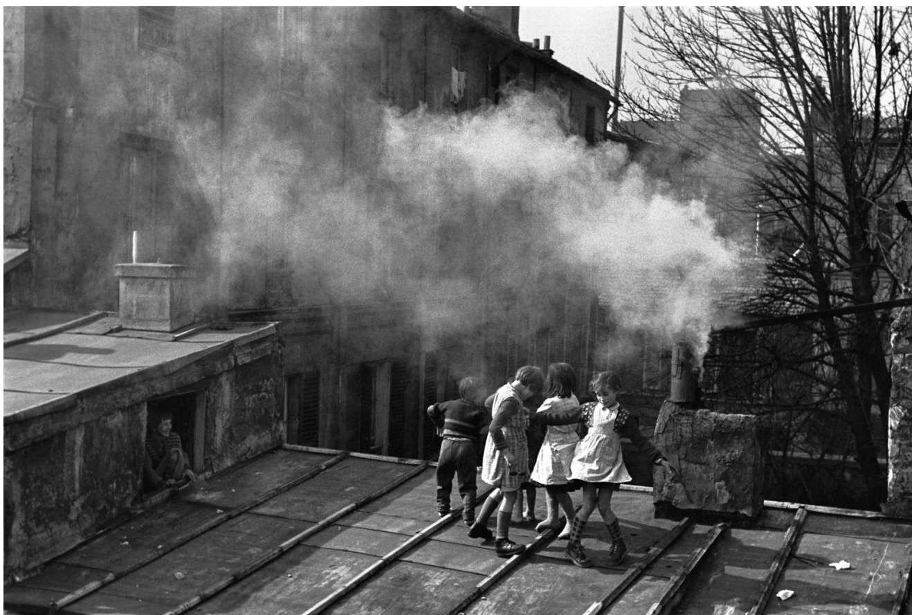
Toits de Ménilmontant, 1952