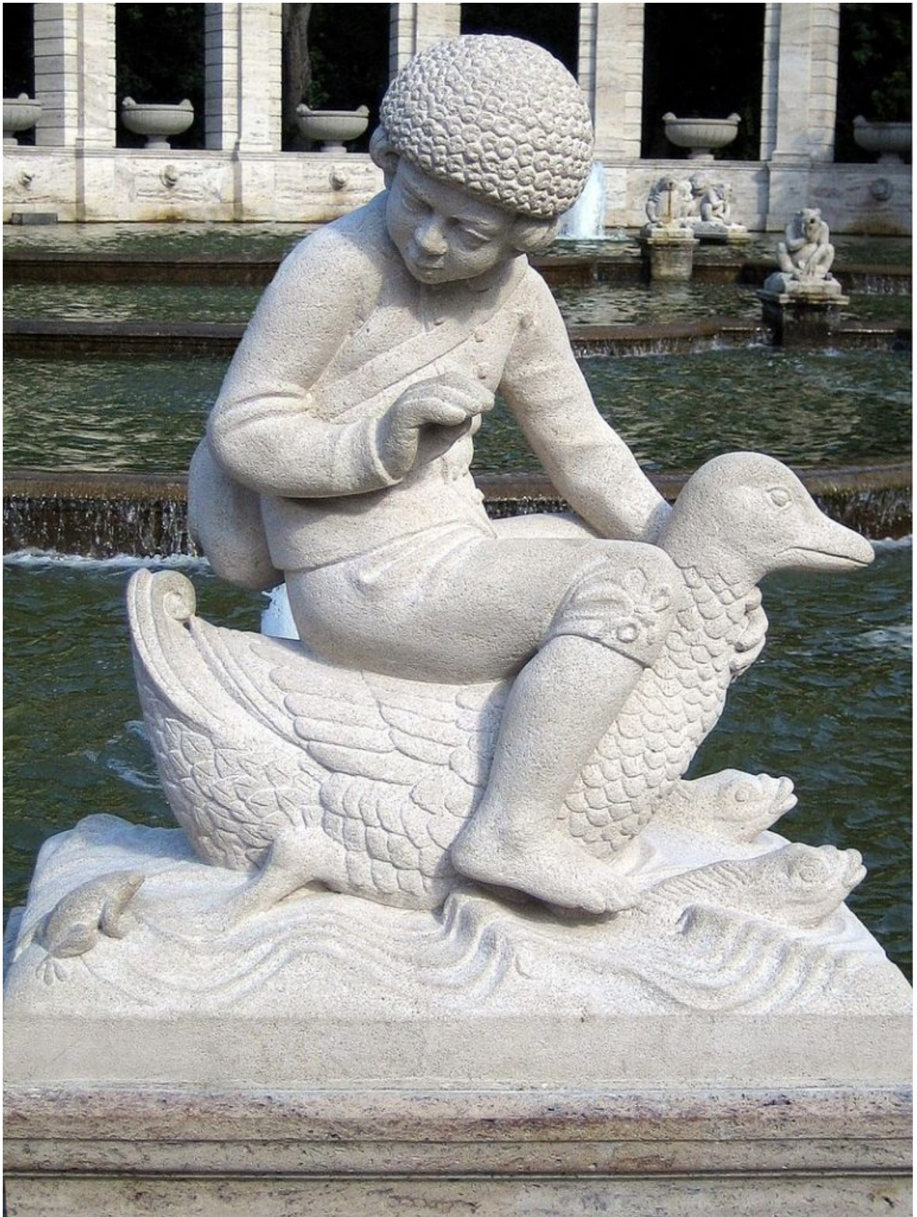
Hansel traversant la rivière à dos de canard. Sculpture d'Ignatius Taschner. Märchenbrunnen [La fontaine des contes] dans le parc de Friedrichshain à Berlin.