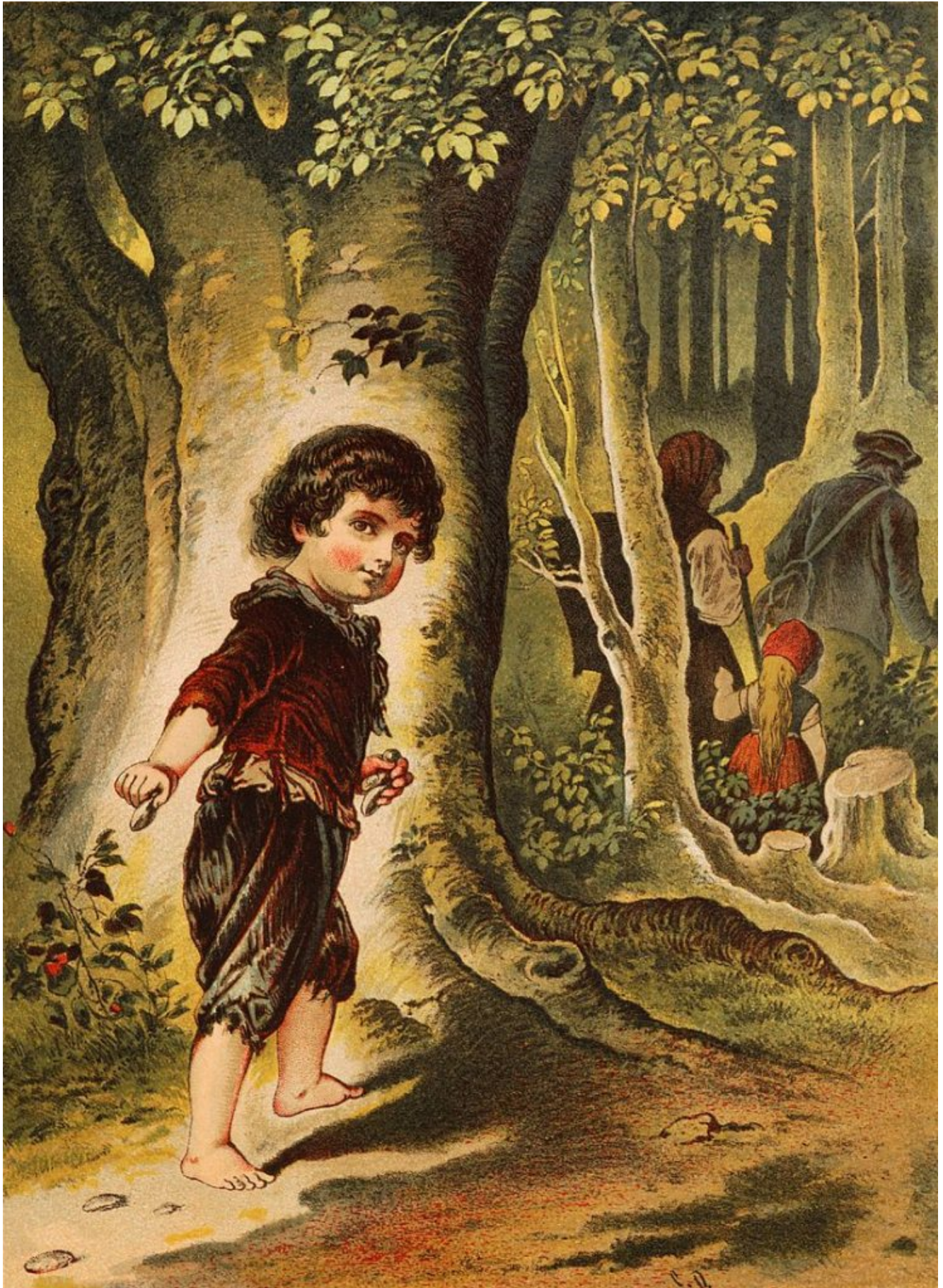
Hansel sème des cailloux. Illustration de Carl Offterdinger , fin du XIXème siècle.