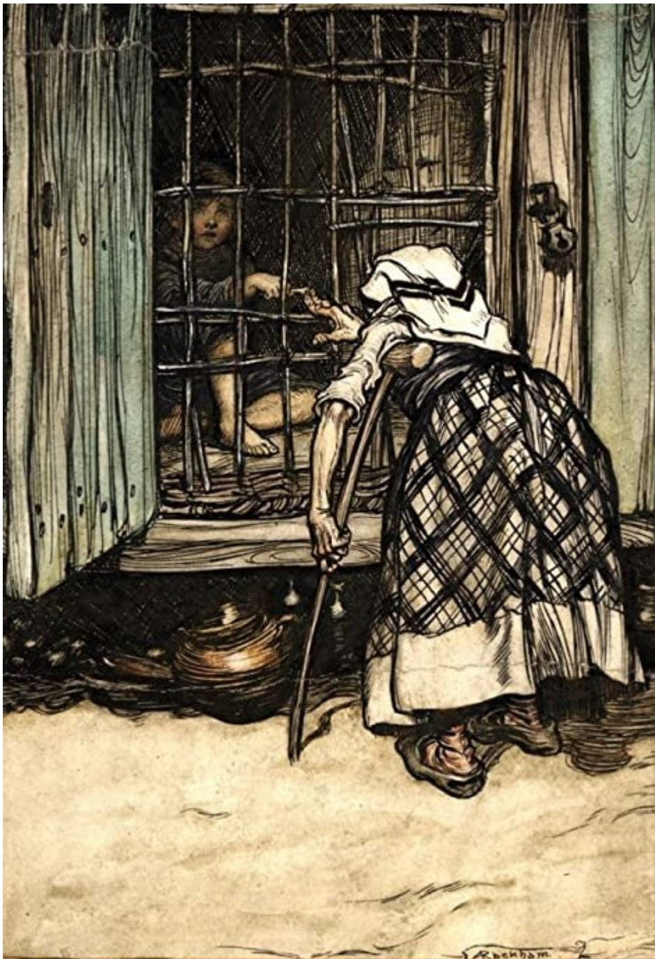
Illustration Arthur Rackham

« Hansel, tends tes doigts, que je voie si tu es déjà assez gras. »