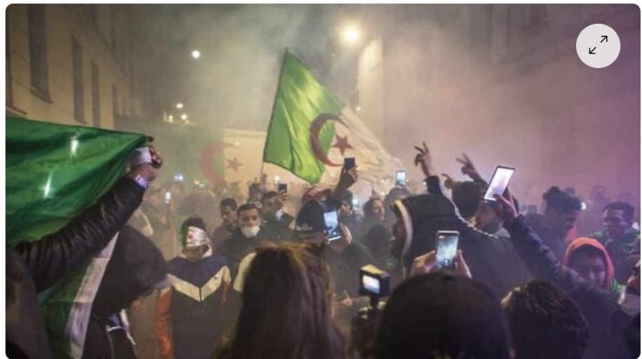
Des débordements ont éclaté à Paris après la victoire de l'Algérie lors de la Coupe Arabe.

https://www.ouest-france.fr/sport/football/coupe-arabe/coupe-arabe-des-debordements-a-paris-apres-le-sacre-de-l-algerie-51c38bf4-603f-11ec-bae8-febd378a060c