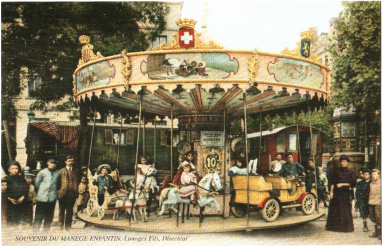
SOUVENIR DU MANEGE ENFANTIN. Limoges Fils, Directeur