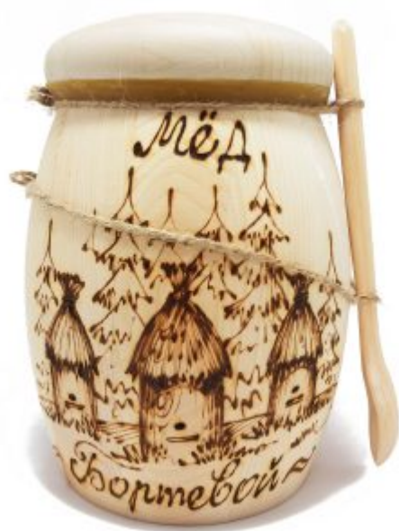
Pot de miel en vente