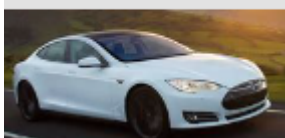
Tesla Model S

À l'heure actuelle, les batteries équipant les véhicules sont très lourdes, très coûteuses et bourrées de métaux rares. Dans celle de la Tesla Model S (et pourtant, je suis un admirateur d'Elon Musk !) par exemple, la plus performante du marché, on ne trouve pas moins de 16 kg de nickel. Or le nickel est plutôt rare sur notre Terre. Ceci fait dire au patron de Tesla France que « le goulet d'étranglement de la transition énergétique se fera sur le nickel » nickel extrait à Goro en Nouvelle Calédonie. Elon Musk sait parfaitement que le nickel est très difficile à trouver.