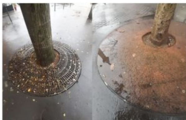
Photo d'un arbre avec une grille Davioud (à gauche) et un composite (à droite). — Xing Le Dantec

La Dingo végétalise les façades d'immeuble (c'est d'un laid !!!!!) mais bétonne les pieds des arbres, va comprendre, Charles !