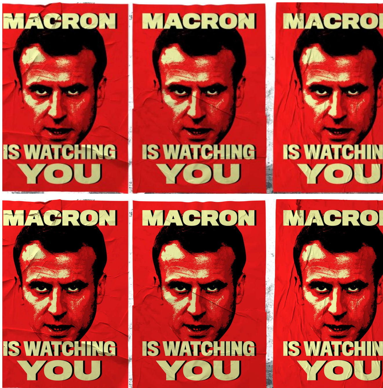
Illustration : allusion au roman 1984 de George Orwell ("Big Brother te regarde") et au Ministère de la Vérité, ou Miniver, le ministère de la propagande.