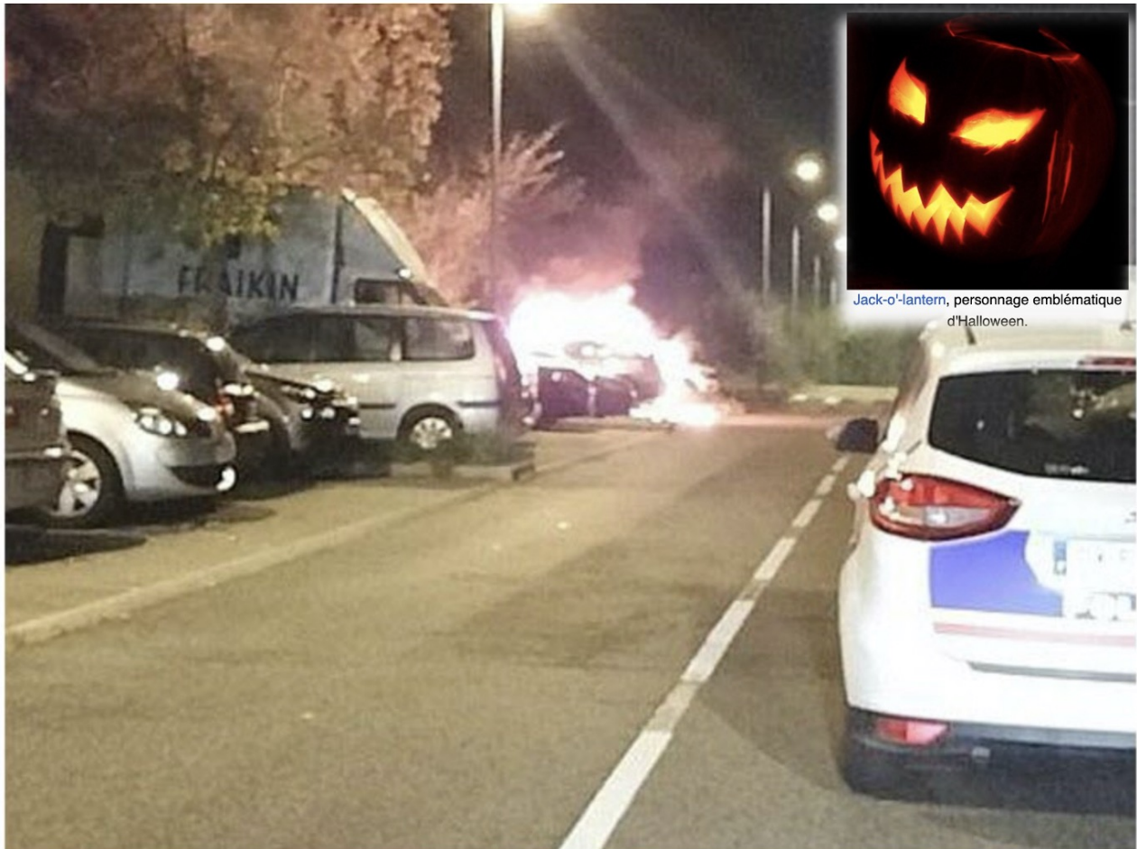
Jack-o'-lantern, personnage emblématique d'Halloween.

À Givors, dans le quartier des Vernes, des poubelles et une voiture ont été incendiées.