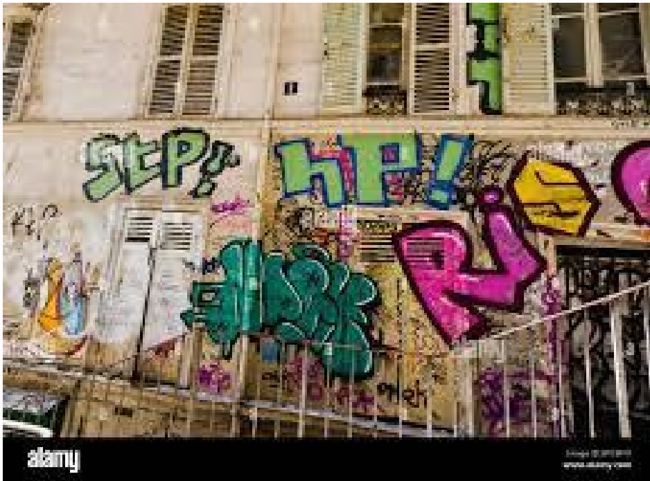
Saccage du quai de Bourbon