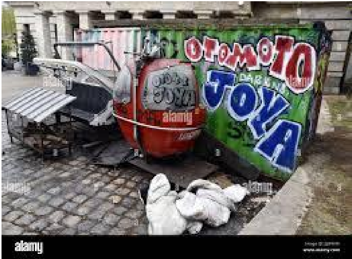
Graffitis sur les murs de Montmartre