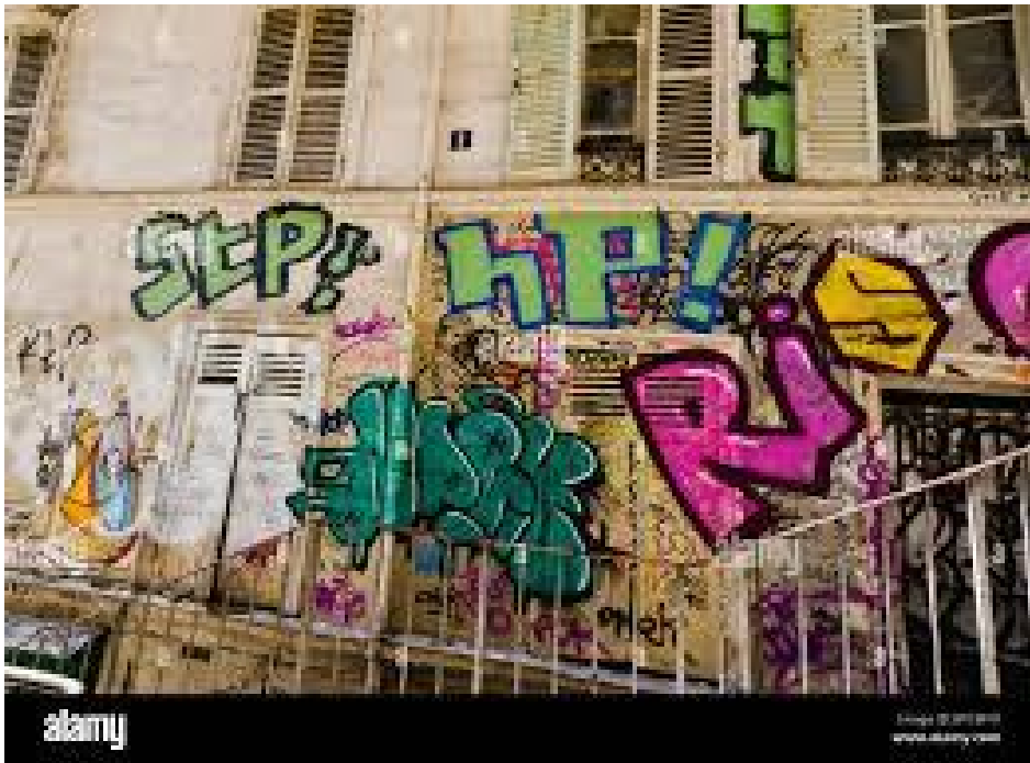
Saccage du quai de Bourbon