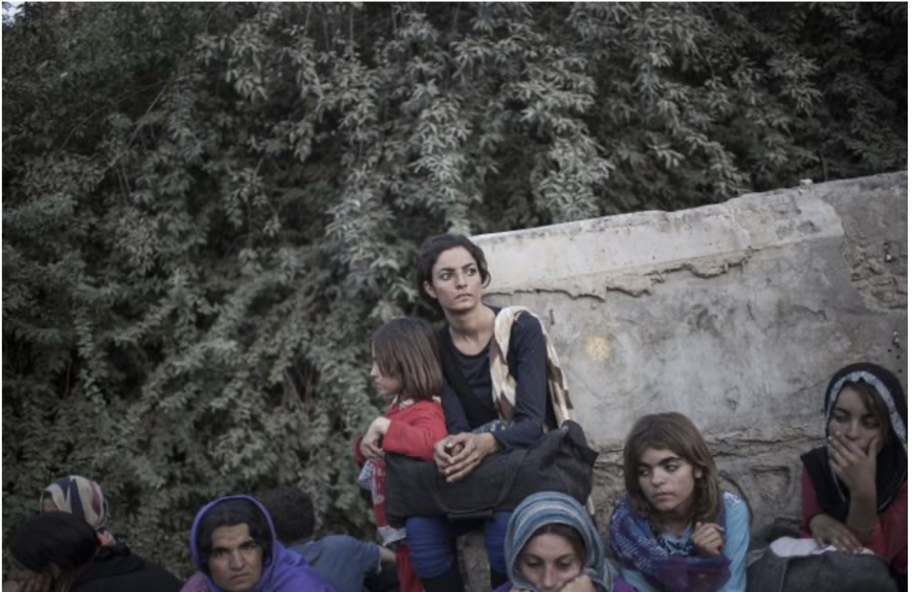
Des femmes yezidies ayant fui le nord de l'Irak après les attaques de Daech