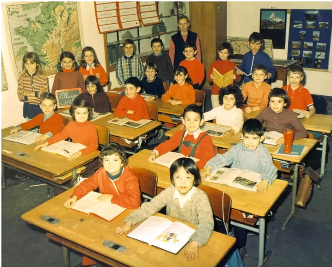
L'école de France – 1970