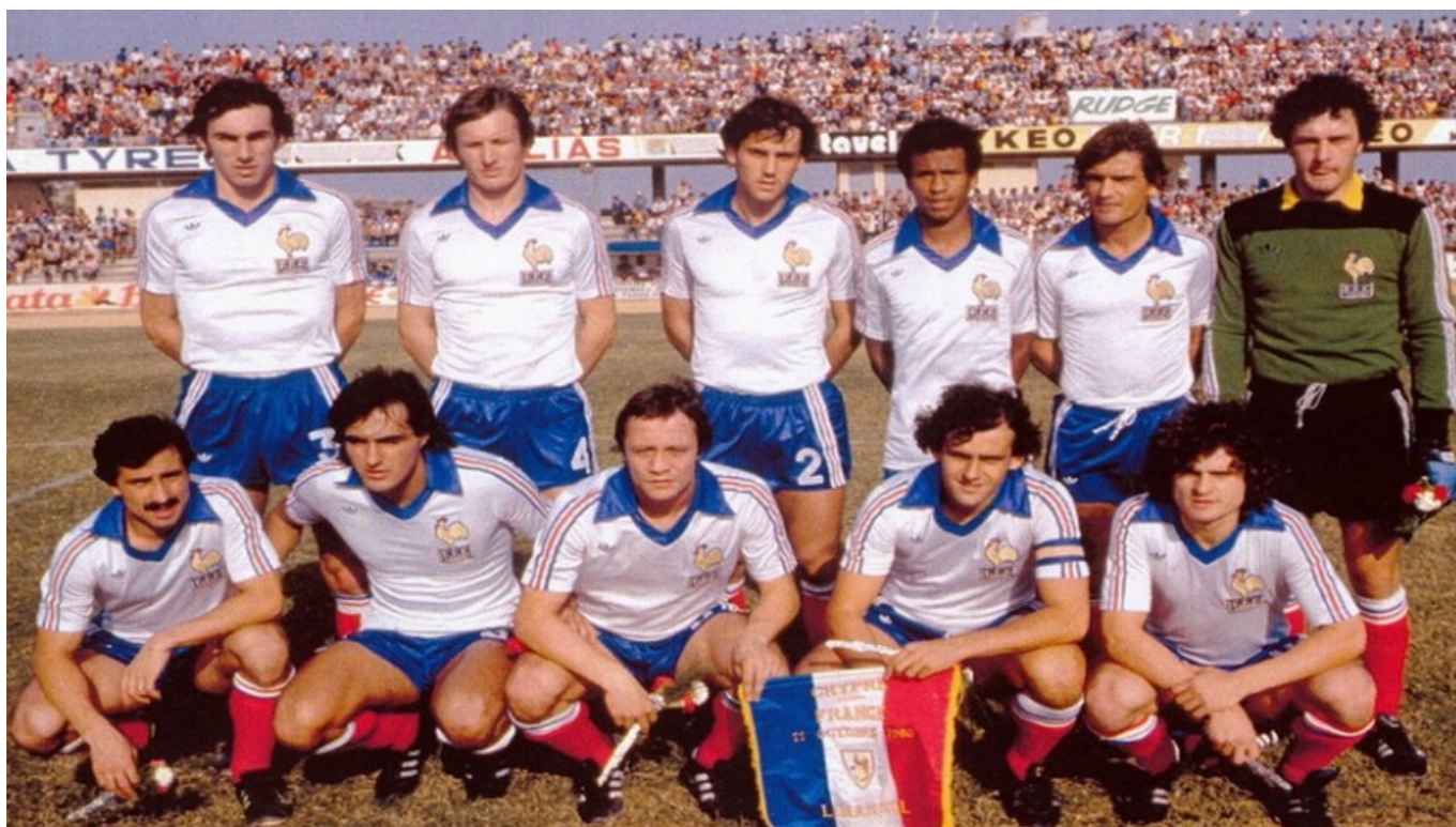
L'équipe de France – 1980