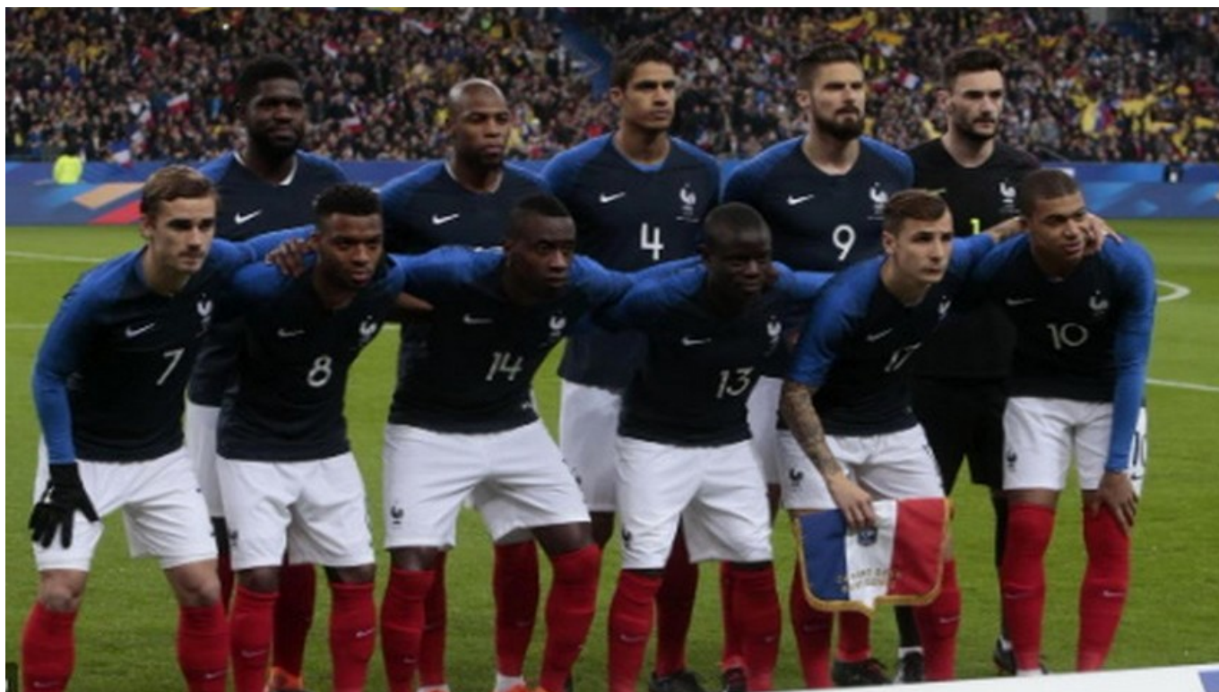
L'équipe de France – 2018