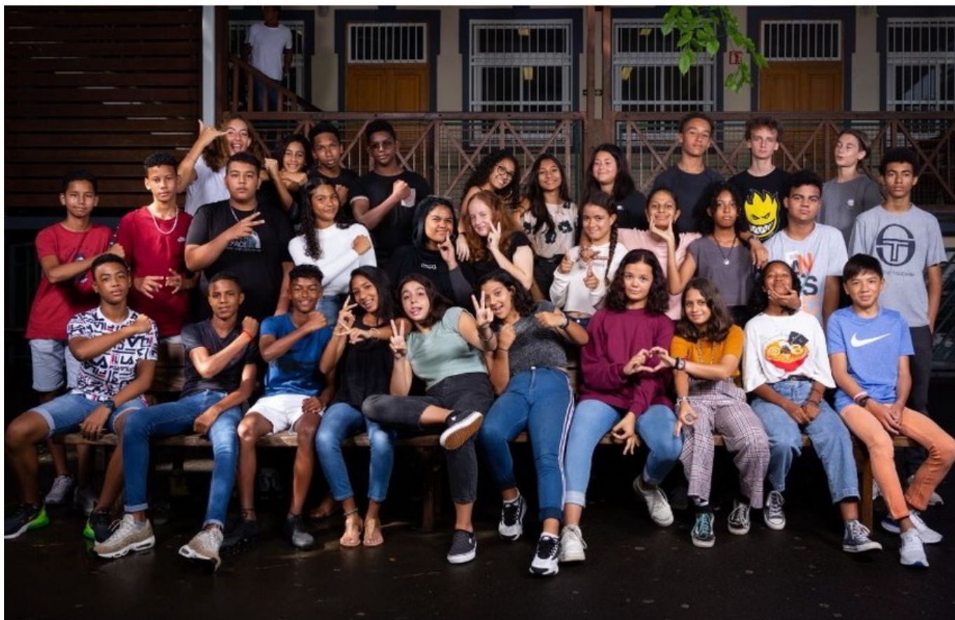
L'école de France – 2022