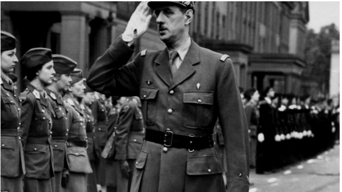
Le général de Gaulle – 1942