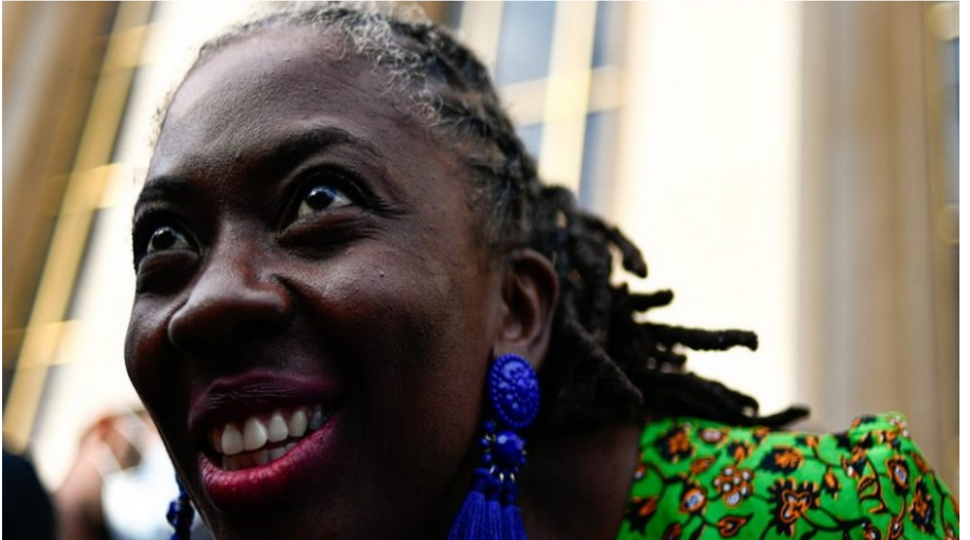
Danièle Obono – députée Française 2022