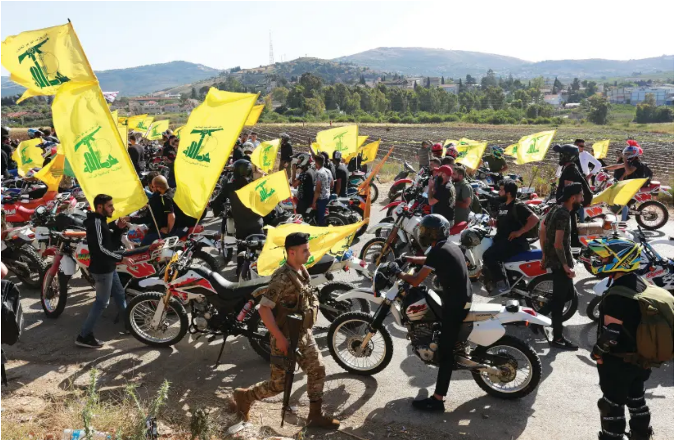
Illustration : des partisans du chef du Hezbollah, Hassan Nasrallah, se rassemblent dans un convoi de motos pour marquer la "Journée de la résistance et de la libération", près de la frontière libanaise avec Israël, en mai.