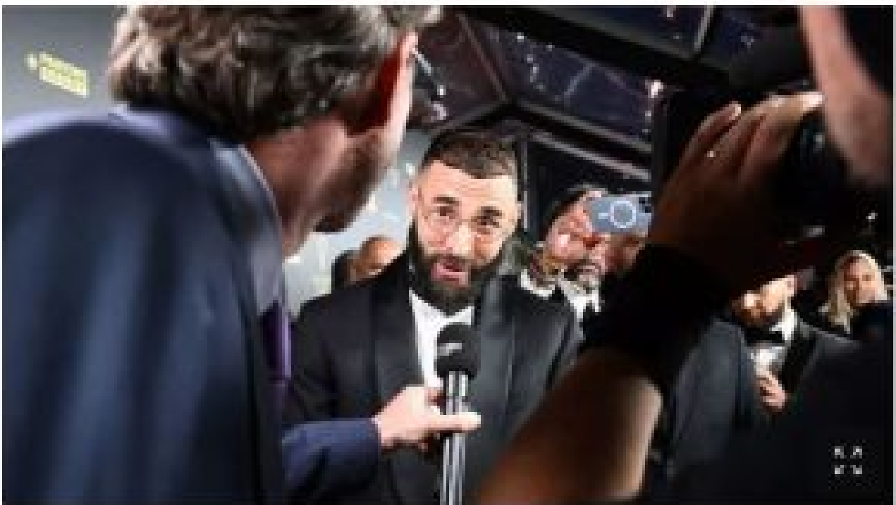
Karim Benzema

Un petit fait divers – certes regrettable – parmi des milliers d'autres concernant des Français sacrifiés gratuitement parce qu' au mauvais endroit, au mauvais moment , mais tellement anecdotique par rapport à la consécration du joueur-racaille franco -algérien, l'islamo-footeux crachant sur la Marseillaise après un hommage aux victimes d'attentats islamistes, le Ballon d'Or Benzema (admirez les lunettes d'intello à la Thuram) rendant hommage " au peuple " (à son peuple ?) et n'oubliant pas d'où il vient (c'est-à-dire d'Algérie – Le Figaro ).