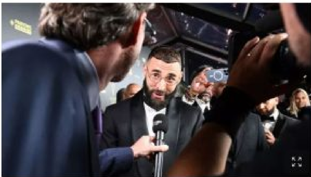
Karim Benzema

Un petit fait divers – certes regrettable – parmi des milliers d'autres concernant des Français sacrifiés gratuitement parce qu' au mauvais endroit, au mauvais moment , mais tellement anecdotique par rapport à la consécration du joueur-racaille franco-algérien, l'islamo-footeux crachant sur la Marseillaise après un hommage aux victimes d'attentats islamistes, le Ballon d'Or Benzema (admirez les lunettes d'intello à la Thuram) rendant hommage « au peuple » (à son peuple ?) et n'oubliant pas d'où il vient (c'est-à-dire d'Algérie – Le Figaro ).