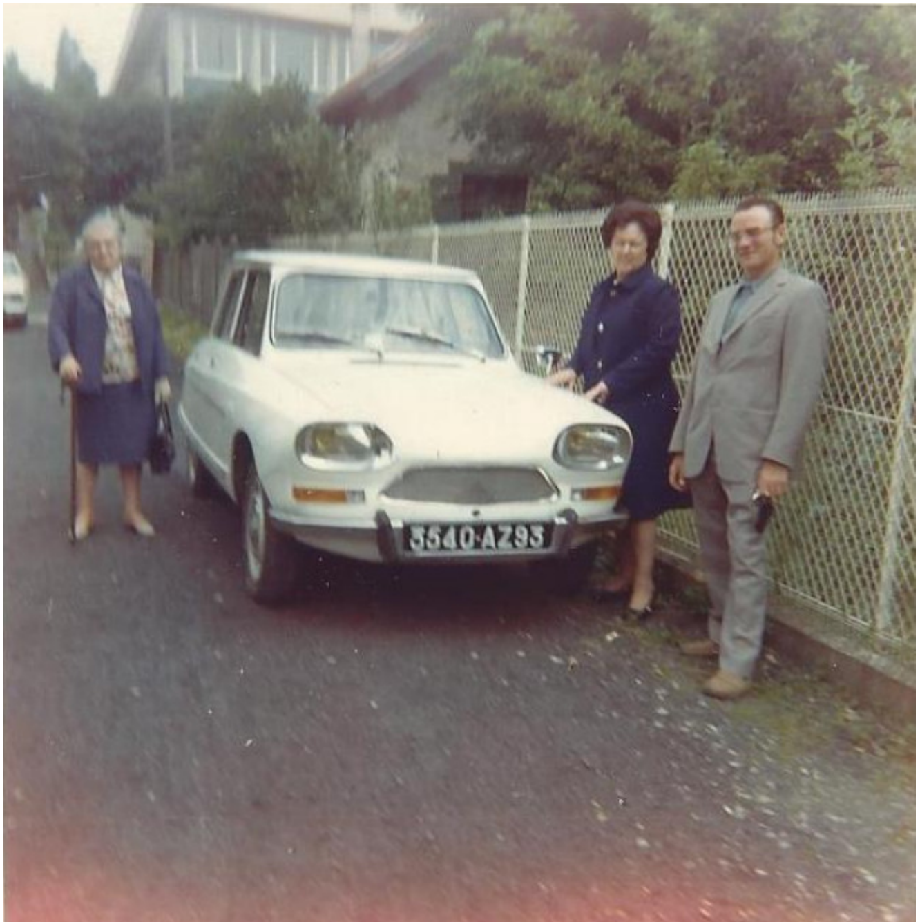
93 SEINE ST DENIS Une Citroën AMI 8 en banlieue parisienne 1975.