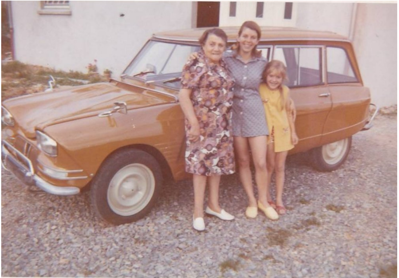
30 Saint-Gilles (Gard), Citroën Ami 6 break à moustache, orange, 1969