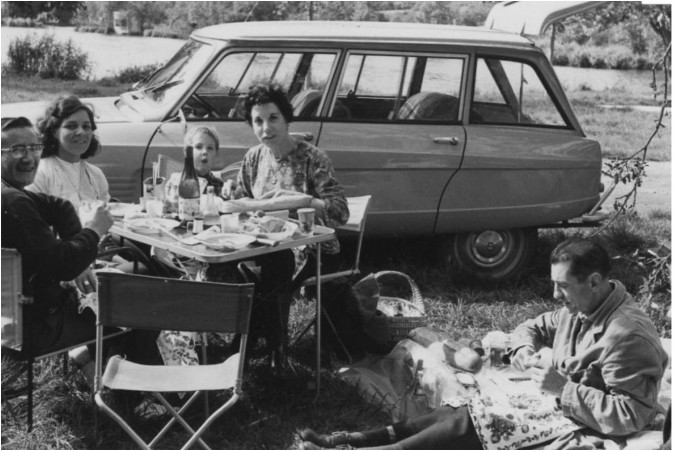
A la bonne franquette, pique-nique en famille, 1970.