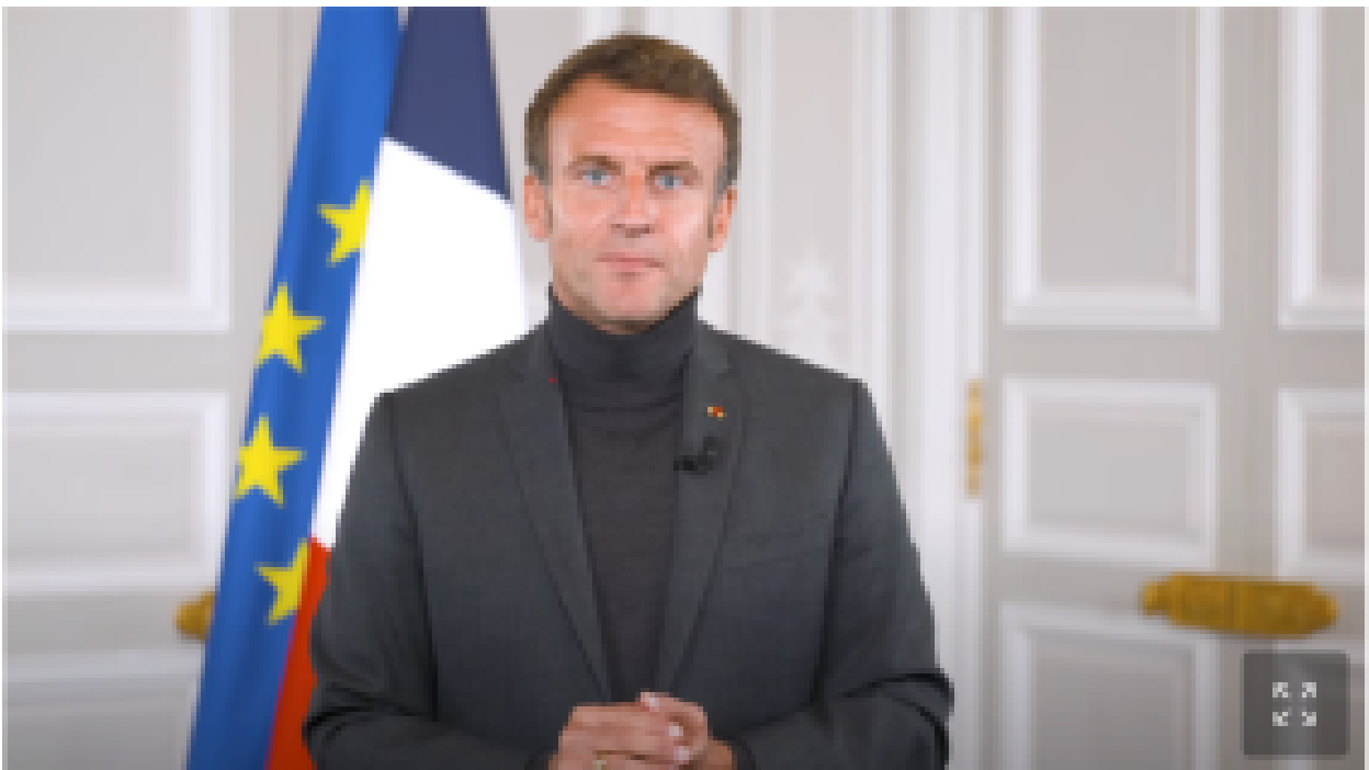
Emmanuel Macron à l'Élysée. Capture d'écran.