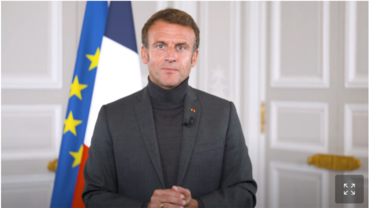
Emmanuel Macron à l'Élysée. Capture d'écran.

écrit par François des Groux | 4 octobre 2022