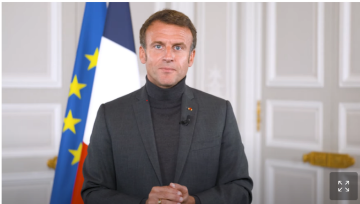
Emmanuel Macron à l'Élysée. Capture d'écran.