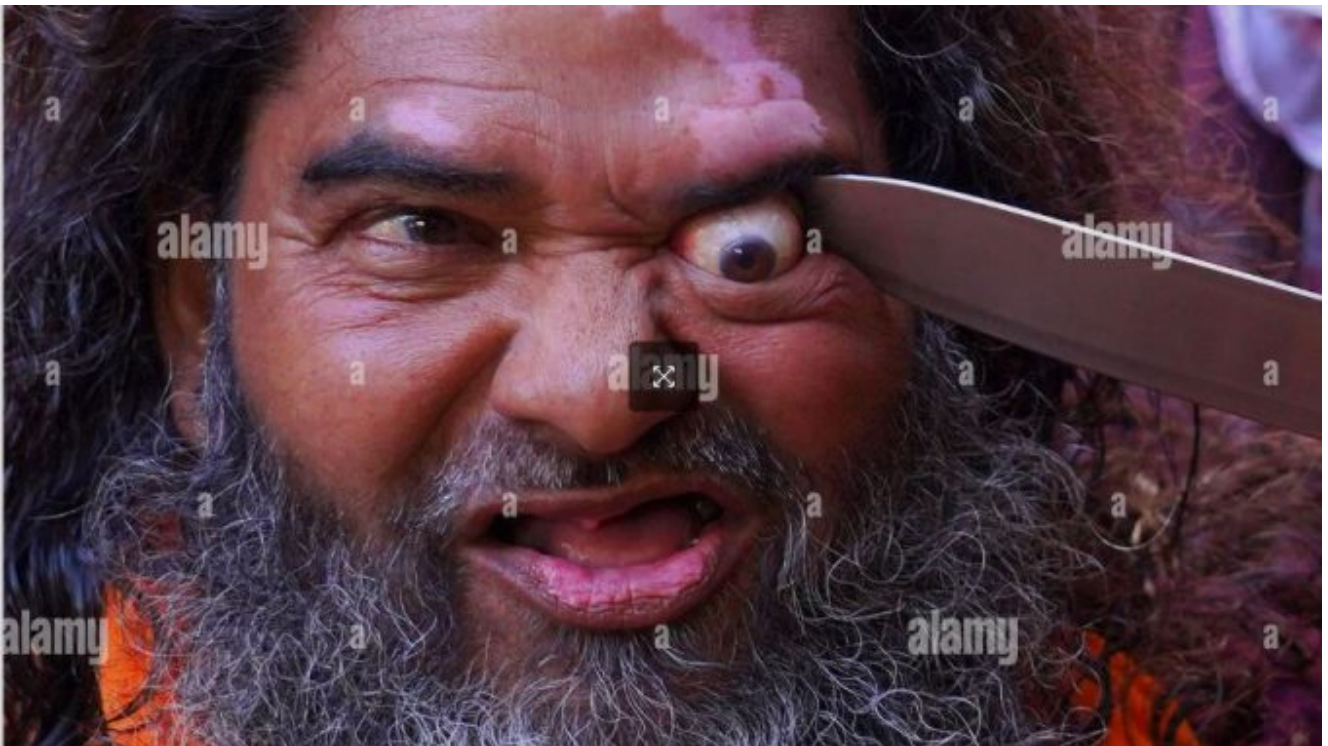
Illustration : Ajmer, Inde. 29 janvier 2022, un dévot musulman indien réalise un coup de couteau dans son œil

Comme on le voit, certains musulmans indiens semblent être des as de la lame et du rasoir.