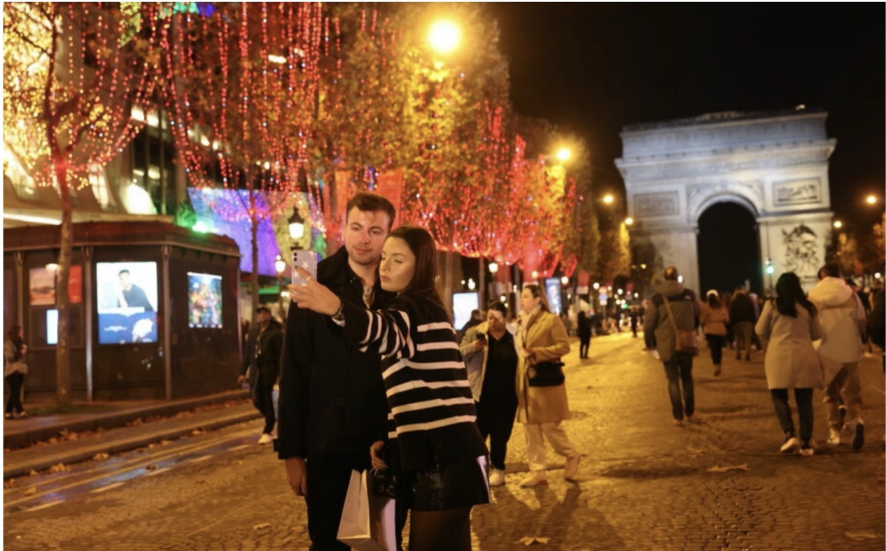
Cette année, même les Champs-Élysées feront des économies sur les illuminations de Noël. (Illustration)

Le comité des Champs-Élysées a décidé, ce mardi, de participer au plan de sobriété énergétique. Il souhaite que les enseignes de l'avenue éteignent leur éclairage au plus tard à 22 heures et cela «immédiatement». Pour les fêtes de Noël, les illuminations s'éteindront chaque soir à 23h45.