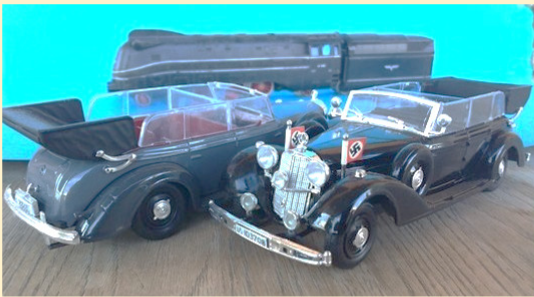
LES DEUX MERCEDES 770k DE RIO