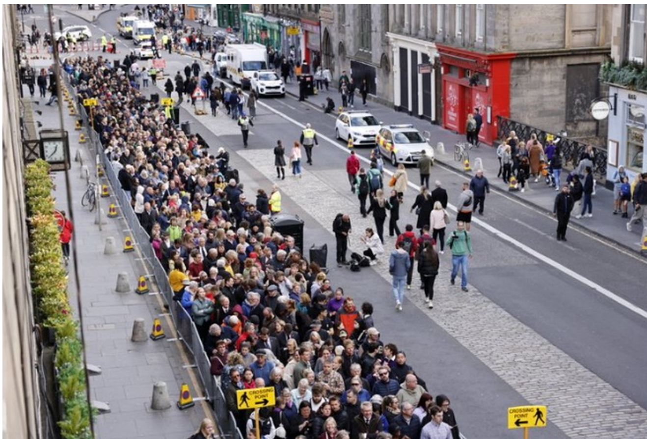
Funérailles de la reine Elizabeth

Les caméras ont dû fouiller dans le tas pendant longtemps pour trouver un basané. On n'en a vu que deux pendant ces cinq jours de recueillement. Deux, qui, d'ailleurs, ne semblent pas être des musulmans. Mais qu'à cela ne tienne. Il faut juste un soupçon de diversité pour faire passer la pilule : « Tous les Britanniques, toutes confessions confondues, se sont inclinés devant la reine. »