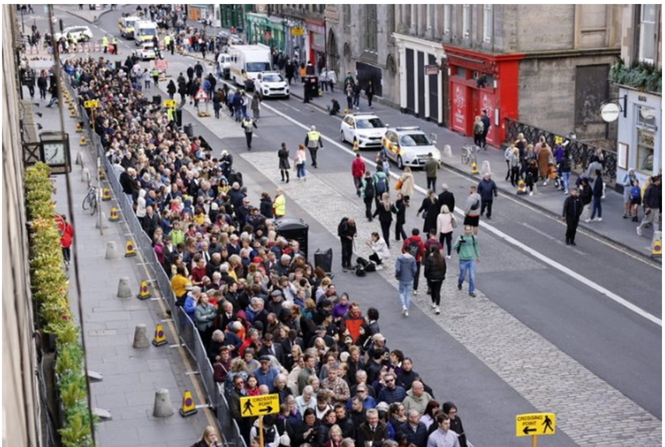
Funérailles de la reine Elizabeth

Les caméras ont dû fouiller dans le tas pendant longtemps pour trouver un basané. On n'en a vu que deux pendant ces cinq jours de recueillement. Deux, qui, d'ailleurs, ne semblent pas être des musulmans. Mais qu'à cela ne tienne. Il faut juste un soupçon de diversité pour faire passer la pilule : « Tous les Britanniques, toutes confessions confondues, se sont inclinés devant la reine. »