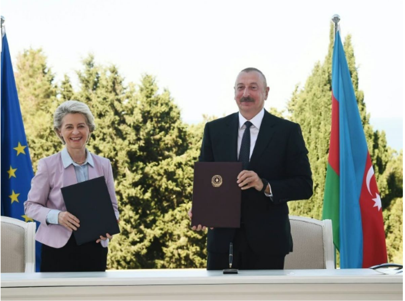
Ursula von der Leyen et le président azerbaïdjanais Ilham Aliyev à Bakou, le 18 juillet 2022.

Ursula von der Leyen se bouche le nez devant le gaz russe mais double les importations depuis l'Azerbaïdjan, pays criminel. Il faut dire qu'elle n'avait levé le petit doigt lors de l'attaque de l'Arménie par les musulmans.