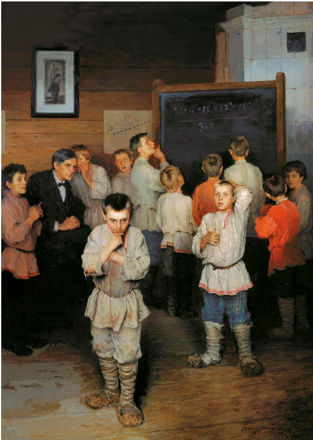
Nikolaï Bogdanov-Belski. Calcul mental à l'école populaire de S. A. Ratchinski. 1895