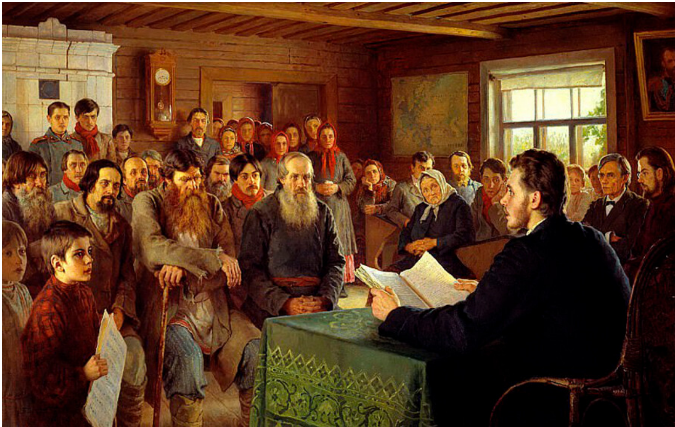
Nikolai Bogdanov-Belski. Dimanche de lecture dans une école rurale. 1895