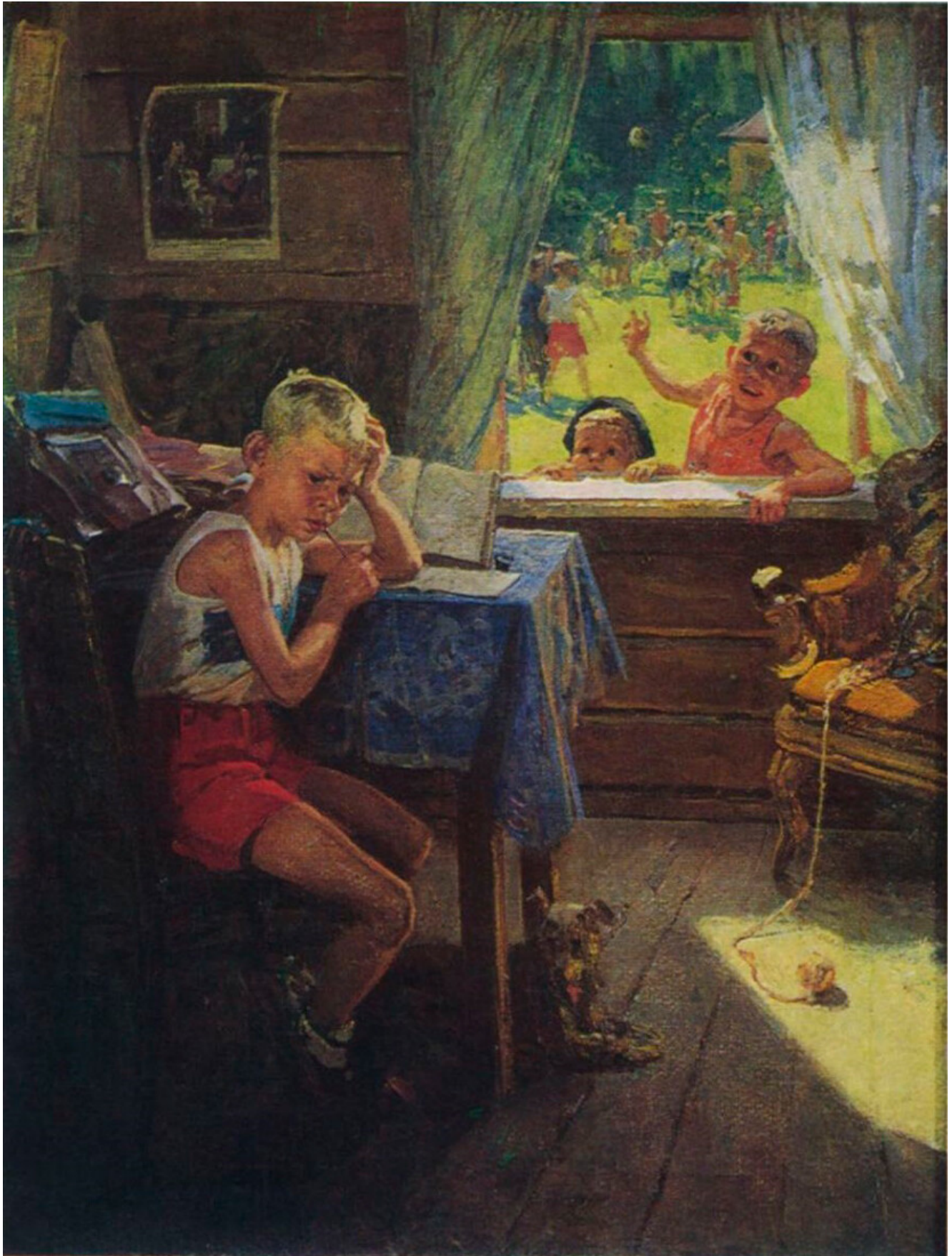
Fiodor Rechetnikov. Les rattrapages. 1954