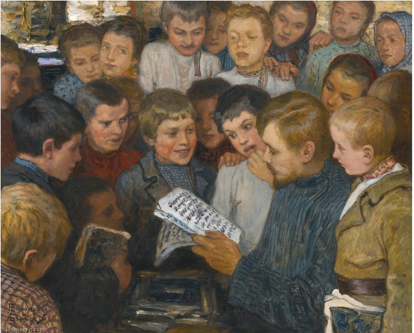
Nikolaï Bogdanov-Belski. Une école de village. Années 1890 Domaine public

Des élèves des campagnes aux scouts soviétiques – les pupitres d'école, les manuels et la vie quotidienne des écoliers ont occupé de nombreux peintres.