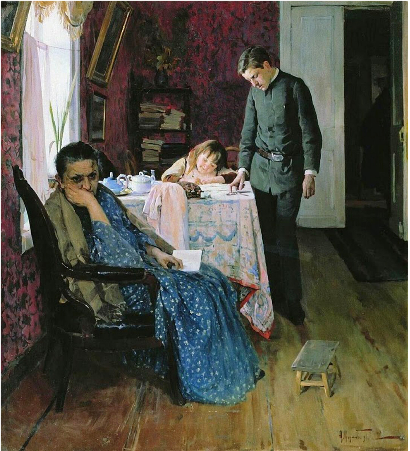
Alexei Korine. Encore échoué. 1891