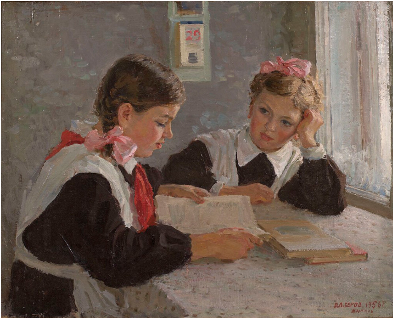
Vladimir Serov. Devoirs . 1956

L'une des peintures les plus connues sur l'école est Encore une mauvaise note de Fiodor Rechetnikov, qui reprend en quelque sorte l'intrigue du tableau Échec (1885) de Dmitri Joukov, mais dans une réalité et un cadre nouveaux. Nous voyons toute une palette d'émotions – la honte sur le visage de l'écopier, la tristesse de sa mère, les moqueries de son jeune frère et les reproches de sa sœur, bonne élève. Seul le chien sympathise avec le garçon.