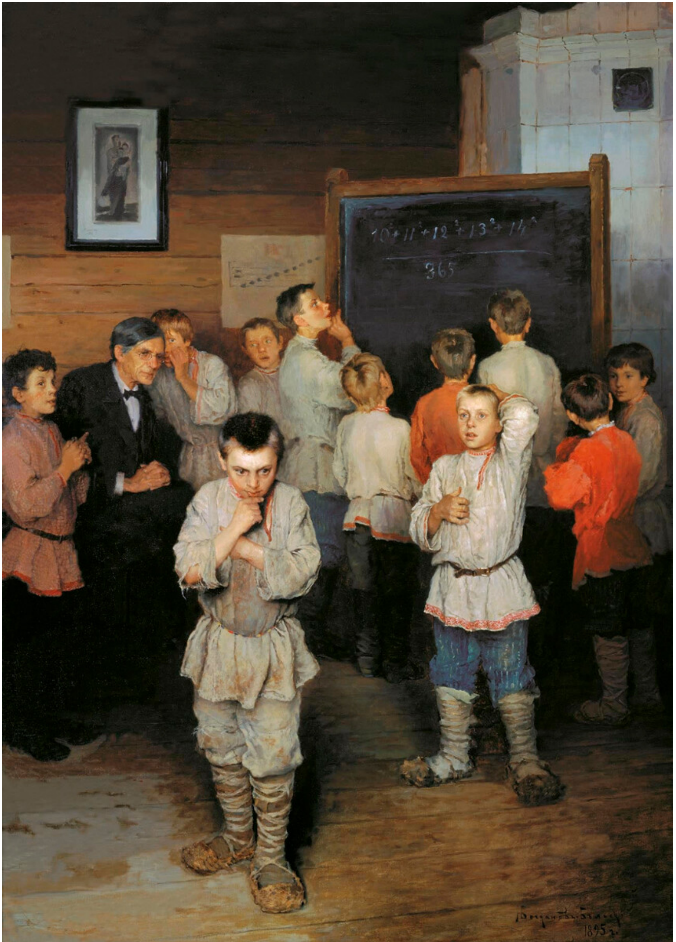
Nikolaï Bogdanov-Belski. Calcul mental à l'école populaire de S. A. Ratchinski. 1895