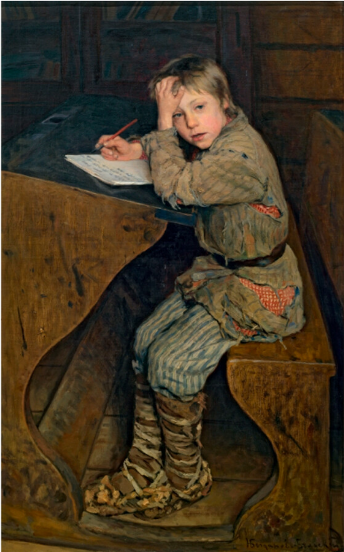
Nikolai Bogdanov-Belski. Rédaction. 1903