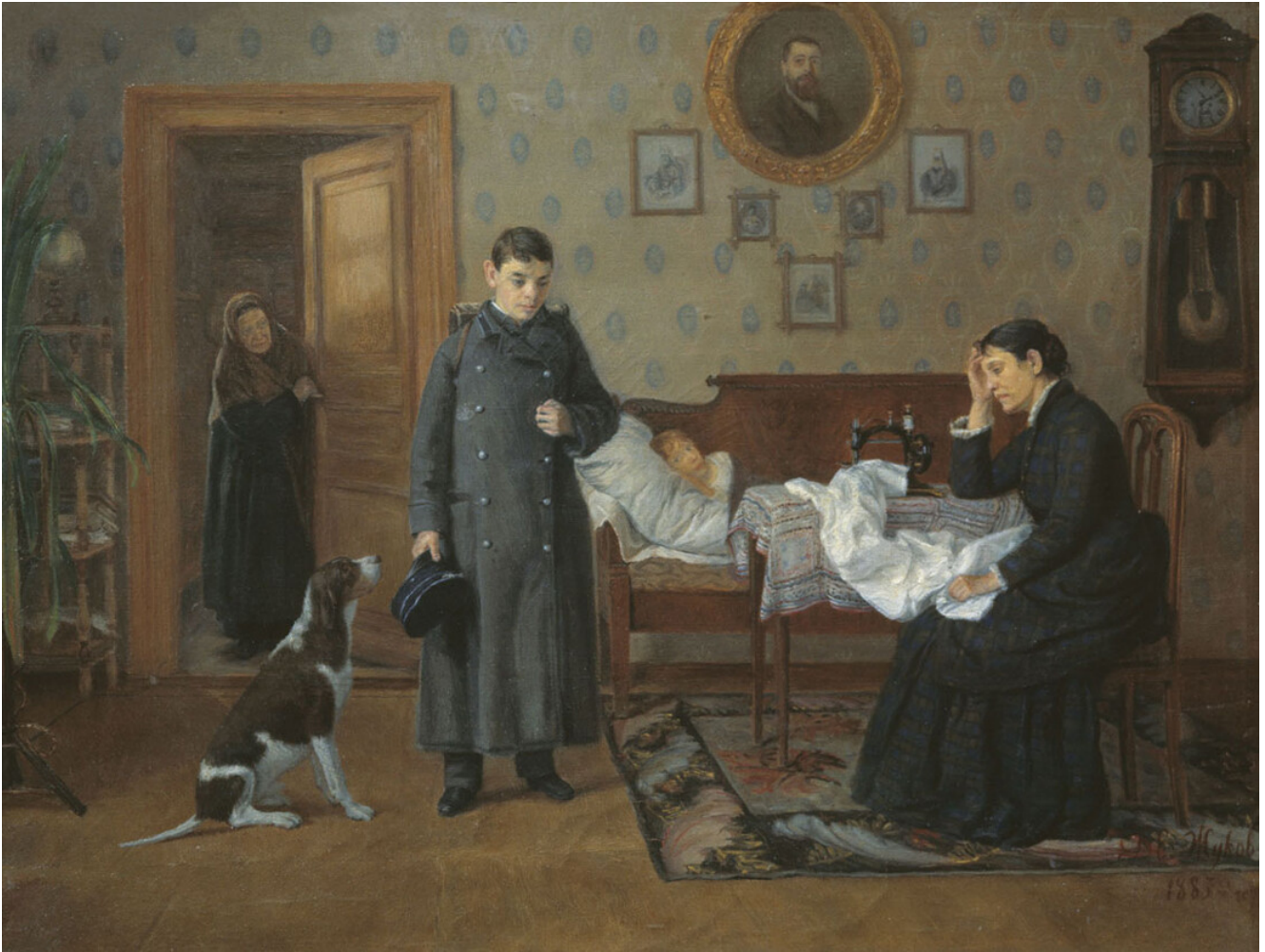
Dmitri Joukov. Échec . 1885