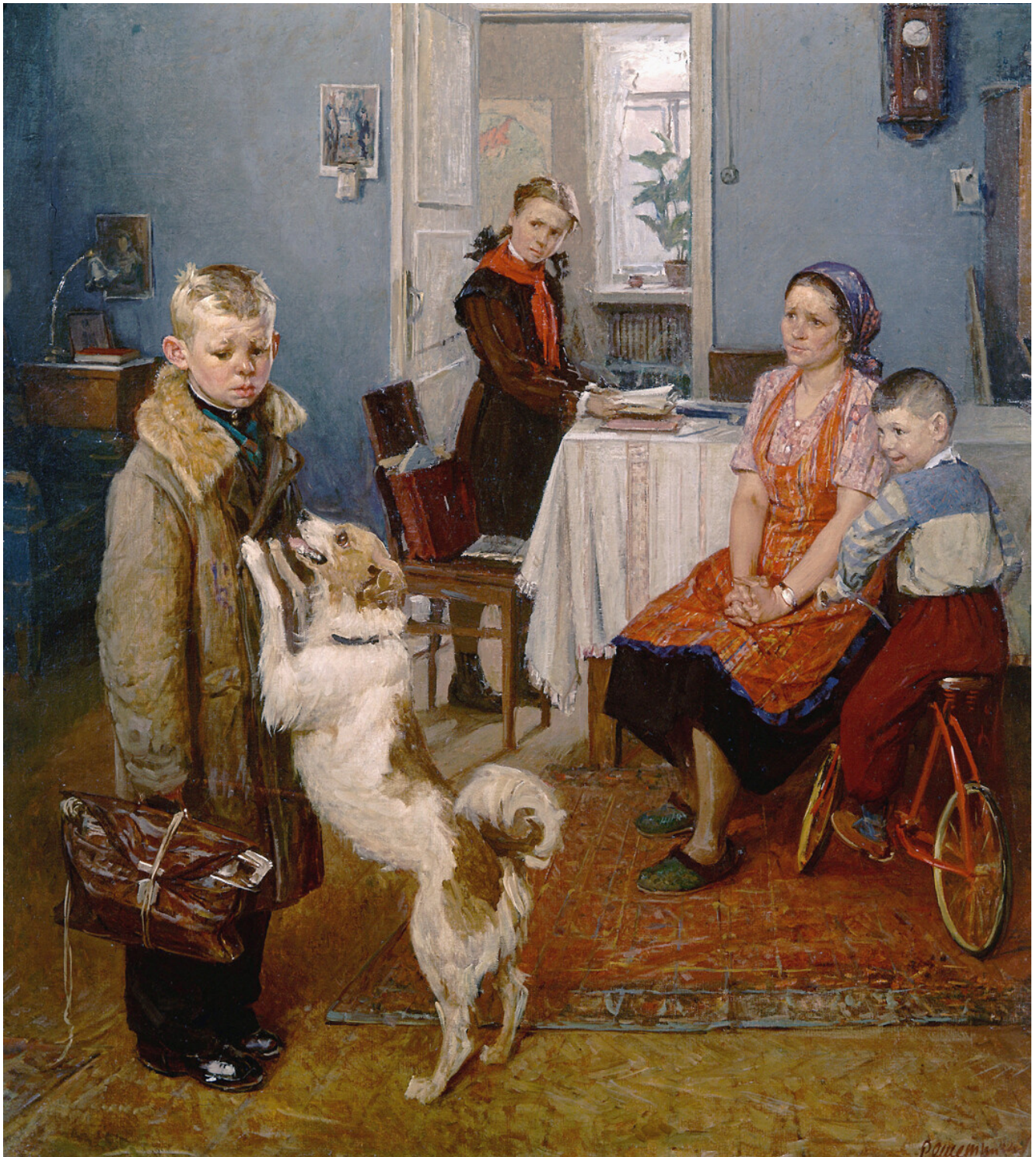
Fiodor Rechetnikov. Encore une mauvaise note. 1952