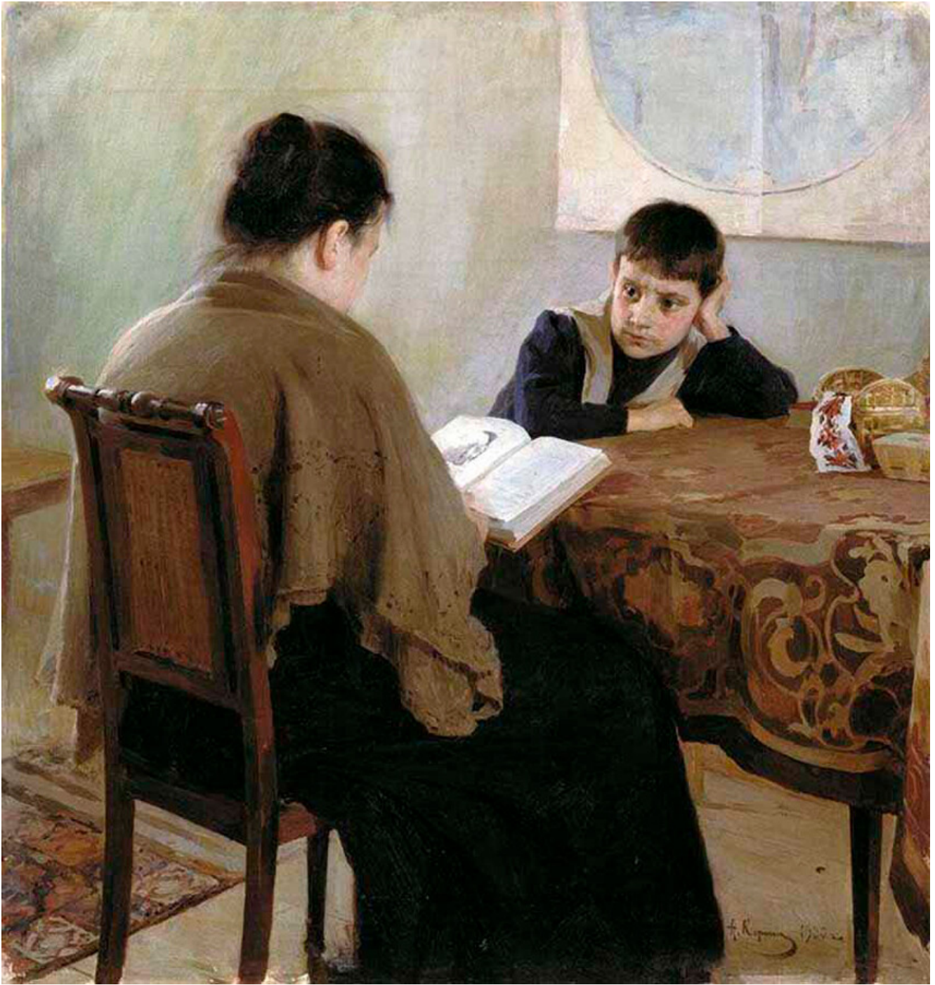
Alexei Korine. Au livre . 1900