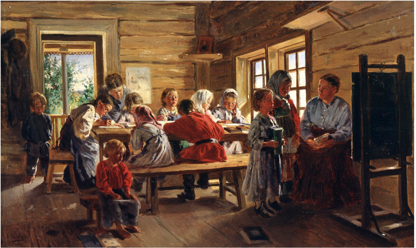
Vladimir Makovski. L'école du village. 1883