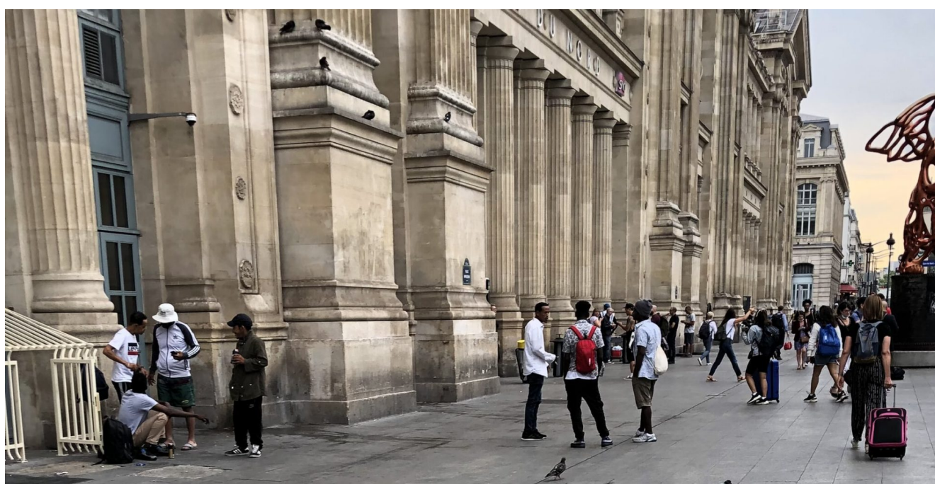
Photo prise le 18 août 2022 devant la Gare du Nord.