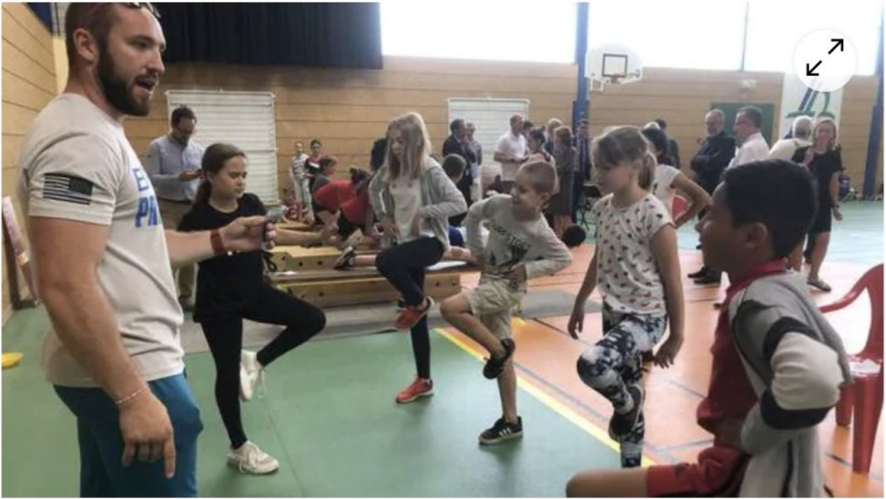
Les Fertois parmi les Sarthois en première ligne ; ils font partie des élèves des sept premiers établissements à être dotés du bracelet connecté. | LE MAINE LIBRE

J'ai emprunté le titre à un commentaire de NDA, comparant les enfants sous bracelet à des poulets bagués et rappelant que le but avoué des bracelets connectés imposés aux gosses c'est pou « tester non seulement la forme physique des enfants, mais aussi la forme morale et sociale. Forme morale et sociale ». Oui vous avez bien lu, SOCIALE !