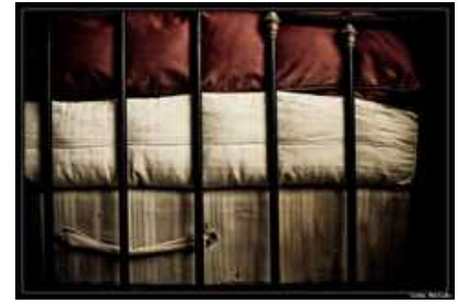
Literie hors d'âge

Et le mobilier est d'époque, celle de mon arrière-grand-mère, qui aimait les beaux objets, celle où il n'y avait pas encore de salle de bains dans cet hôtel.