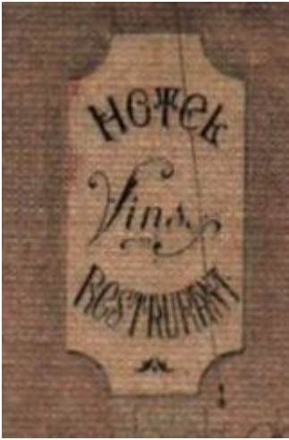
Hôtel, Vins, Restaurant