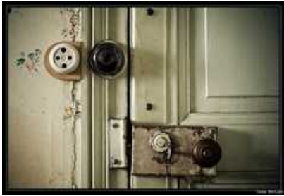
Poignée de porte