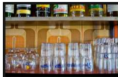
Derrière le comptoir

Pour monter à l'étage, un escalier en bois, à la rampe patinée par le passage de nombreuses mains.