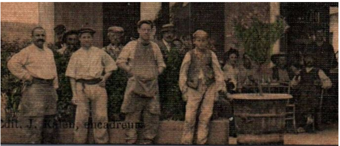
Et le personnel (avant l'Africanisation de la France et les tam-tams).