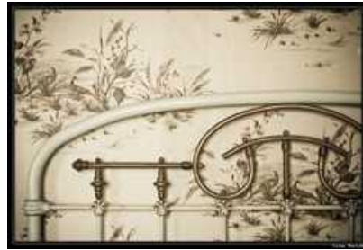
Lit en fer