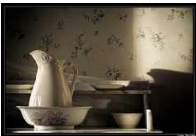
Nécessaire de toilette

Et le mobilier est d'époque, celle de mon arrière-grand-mère, qui aimait les beaux objets, celle où il n'y avait pas encore de salle de bains dans cet hôtel.