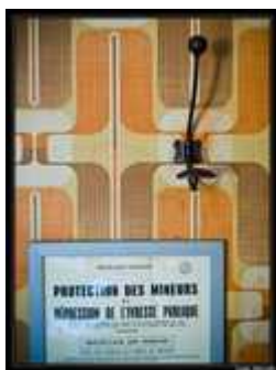
Protection des mineurs

En bas, le bar est une grande salle, qui peut accueillir une tablée d'une cinquantaine de personnes, avec un bar assez long pour qu'on puisse s'y accouder à une dizaine.