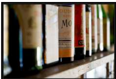
Goudron Monéger Extra