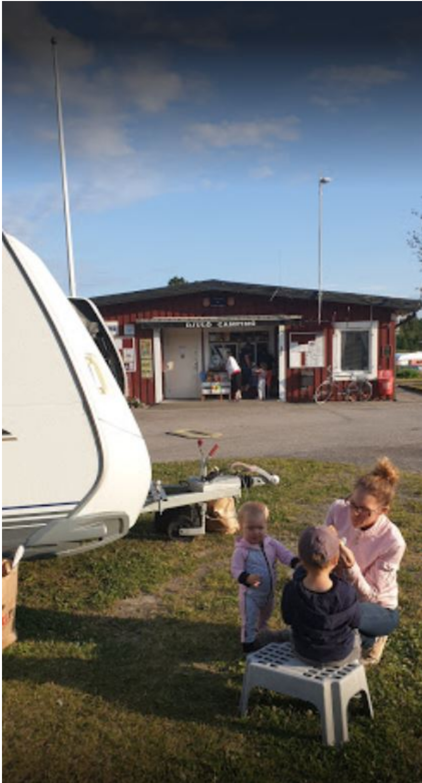
Un camping familial