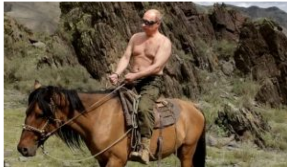
Poutine à cheval dans les montagnes de la Sibérie

une ancienne photo de Vladimir Poutine à cheval torse nu en Sibérie.